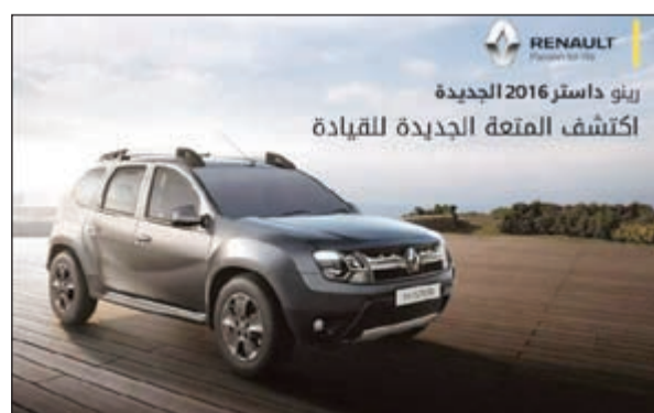
أطلقت شركة عبدالمحسن عبدالعزیز البابطين، الوكيل الحصري لسيارات «رينو» في الكويت، عرضا استثنائيا على طرازي «داستر 4x2» و«سيمبول» في إطار «حملة مارس 2016».

وتتميز «داستر» أيضا بمساحة إضافية للتخزين، ومستوى أكبر من الراحة، دون أن ننسى تركيزها على تعزيز معايير أعلى من السلامة. وتشتمل السيارة عدد كبير من الأنظمة أبرزها ESP اي برنامج الثبات الإلكتروني على العجلات الأربع، فضلا عن نظام كروز كوفترول «تثبيت السرعة»، وجهاز استشعار خلفي يتنبه السائق في حال اقترابه من الاصطدام بجسم غريب. وقد زودت «داستر» بمحرك قوي سعة 2,0 لتر بقوة 135 حصانا مع ناقل سرعة ألي. أما «رينو سيمبول» المنتمية إلى فئة سيارات السيدان فهي مصممة خصوصا لتلبية احتياجات عملائها الراغبين في اقتناء سيارة عائلية تجمع بين الأناقة والراحة والسعر المعقول تتميز رينو سيمبول للمقعد الخلفي.