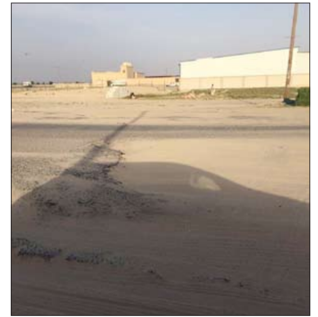
الحفر تملئ طرق كبد واسطبلات الجهراء وتيماء

حفرة اشبه بـ«جليب» الميامة تغطي حفرة يمر بها يوميا أهالي تيماء قطعة 6 وتسبب اضرارا كبيرة للمركبات، رغم ان الأهالي حاولوا كثيرا ردهما بالتراب دون جدوى.