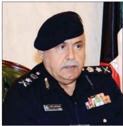
الفريق سليمان الفهد

أنا وافد يمني ومحِب لأرض الكويت الطيبة وعلى أرضها منذ 1971/8/18 وخبرها علينا لا يعد ولا يحصى، ومنذ ما يقارب الثلاث سنوات تقدمت بطلب لاستقدام ابنتي التحاق بعائل عند أمها وأختها الصغيرة وللأسف في كل مرة ترفض معاملتي ومعني كل الأوراق الرسمية وشهادة المحكمة والخارجية بأنها غير متزوجة وهي وحيدة في اليمن (حضر موت) والأوضاع لا تسر، كل الأمل والرجاء بعد الله تعالى في موافقة الفريق سليمان الفهد وكيل وزارة الداخلية.