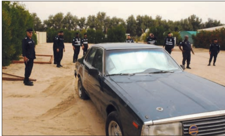
سيارات يعود تاريخ تصنيعها إلى عقود يتم إخفائها في مزارع عقب الاستهتار

الوحيدة المخولة الدخول إلى المزارع حيث تم ضبط جميع المركبات المرصودة. أسفرت الحملة عن ضبط 29 مركبة رياضية ومركبتين من نوع جي تي ب «تايرين» بالإضافة إلى مركبة محملة بالعجلات لاستبدال التالف نتيجة القيادة المتهور.