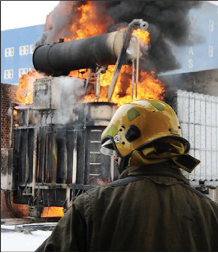
الحريق خلف سحبا دخانية كثيفة في سماء حولي