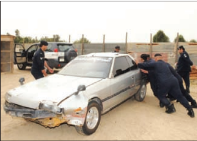
رجال الامن يسحبون إحدى المركبات المتهاكئة