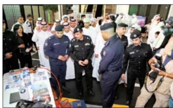
المهنا يتابع فعاليات المعرض