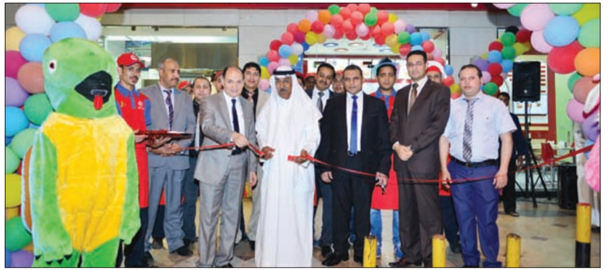
قصر شريط افتتاح الفرع الجديد لـ «نايف» في الدسمة

أعلن البنك الأهلي الكويتي عن رعايته مهرجان المأكولات Taste of Q8 للعام الثاني على التوالي المقرر إقامته في مارينا كرسنت من الفترة 17 إلى 19 مارس الجاري. ويسلط هذا المهرجان الضوء على الأطباق المتنوعة والموائد العامرة بالمأكولات الشهية في المجتمع الكويتي ويتيح للزوار تجربة تذوق الأطعمة المختلفة التي تقدمها المطاعم