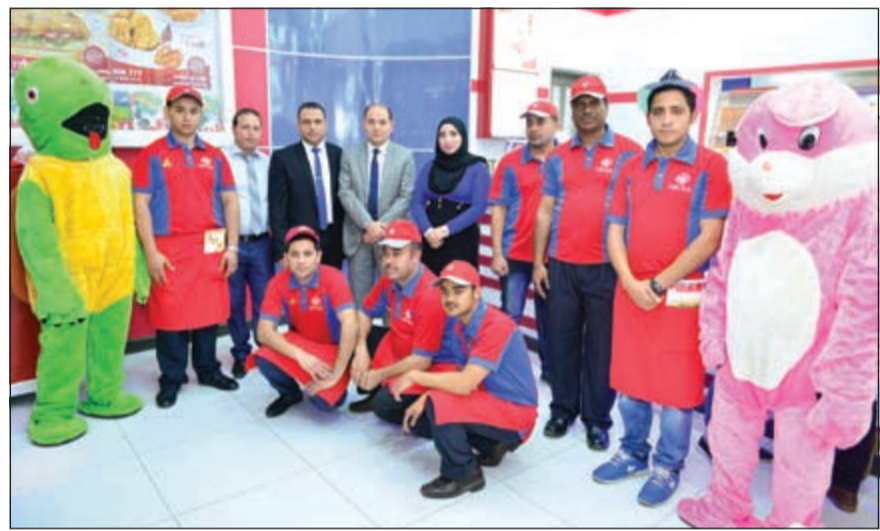
الشخصيات الكرتونية شاركت فرحة الافتتاح

على الأعلاف الخبثانية 100٪ في مزارع نايف الكويتية بالإضافة إلى المذاق الأصلي الذي تختص به منذ افتتاح أولي فروعه، ليضيف دجاج نايف بافتتاحه هذا الفرع نجاحا جديدا لسلسلة نجاحات استمرت لأكثر من 30 عاما.