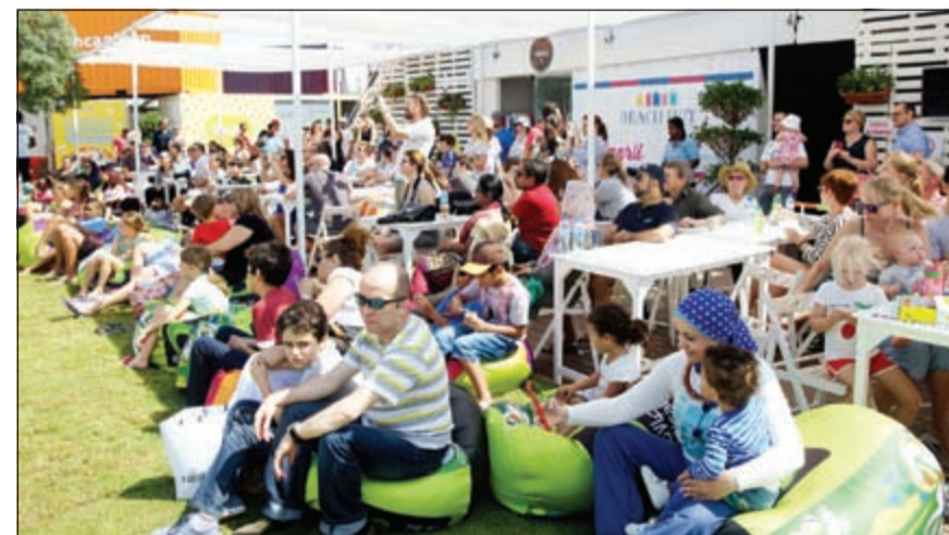
مشاركة جماهيرية واسعة

عملت على تلبية الأذواق المتنوعة لأكثر من 200 جنسية مختلفة من قِيمي وزوار دبي، وقدم كل منهم قوائم جديدة خصيصا لتقديم تجارب طعام لا تنسى خلال المهرجان، كما اتسم المهرجان بإقامة أنشطة وفعاليات عائلية مختلفة بهدف إبراز مدى التنوع في دبي. واحتضنت مراكز التسوق العديد من الفعاليات، ومن