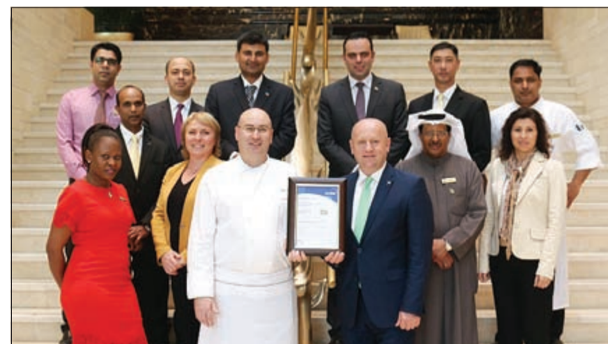
لقمة تنكارية بمناسبة الحصول على شهادة HACCP لسلامة الغذاء

وصول الطعام إلى المطبخ وحتى مرحلة تقديمه إلى الضيوف، وقد عملت العديد من الأقسام بعناية فائقة ومتكاملة لضمان إنجاز جميع المتطلبات بنجاح.