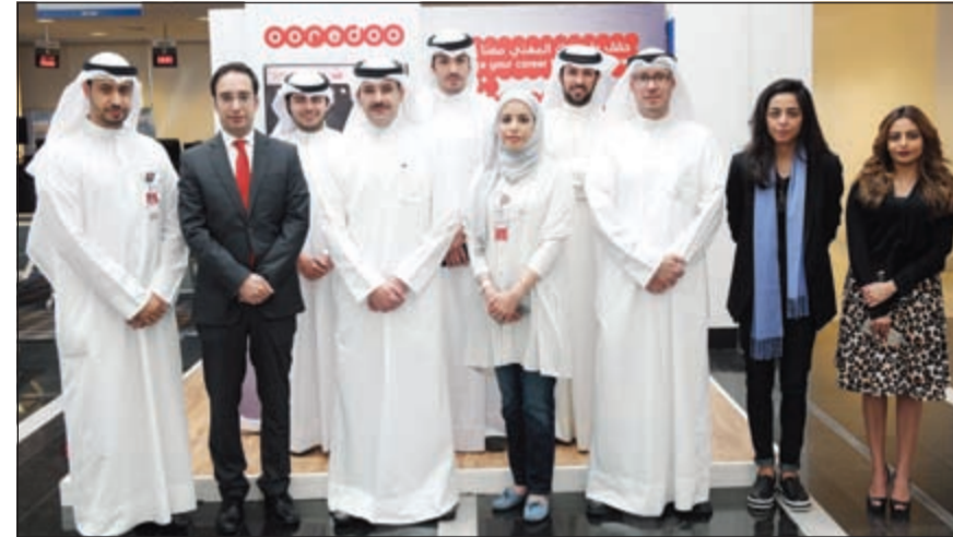
وقد إداري Ooredoo في ركن الشركة بالمعرض

لهم بالاستفادة من تخصصاتهم العلمية في حياتهم المهنية. وتمتيز Ooredoo بيئة عمل حيوية تشجع على تبني الأفكار الجديدة وتنمى الإبداع لدى الموظفين، حيث تقوم الشركة بشكل مستمر بتقديم فرص التدريب والخبرة لموظفيها في مختلف المجالات إيماناً من الشركة بأن ذلك يعود بالنفع على مصلحة العمل في الشركة.