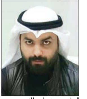
السفير محمد جاسم المديرس

طرح سفير السلام ومكافحة الإرهاب بمنظمة الوحدة العربية الأفريقية محمد جاسم المديرس فكرة جديدة لتنويع مصادر الدخل تتمثل في الدعوة لتنشيط السياحة الكويتية لندرج على الدولة ملايين الدنانير وتؤدي إلى إنعاش اقتصادي ورواج بالأسواق وإيجاد فرص عمل جاذبة للشباب الكويتي، وتضع البلاد على خارطة السياحة الإقليمية والدولية. وقال المديرس: لا يخفى علينا أن الكويت انضمت لعضوية المنظمة العالمية للسياحة، وأعدت خطة إستراتيجية للسياحة لـ 20 عاماً مقبلة، ونقوم حالياً بتنفيذ أكثر من 37 مشروعاً قيد الإنشاء، منها مشاريع ترفيهية ومجمعات ومنتزهات ومشاريع الإقامة السياحية، كما تقوم الدولة بتنفيذ مشروعات كبرى مثل تحويل كامل جزيرة فيلكا التي تقع على بعد 20 كلم شرقي العاصمة الكويت - وهي ثاني أكبر الجزر الكويتية - إلى قري ومنشآت سياحية ترفيهية ومشاريع الأخرى مثل جزيرة بوبيان.