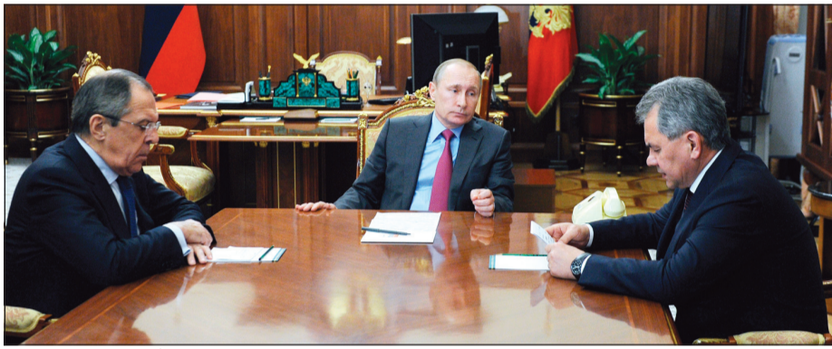
الرئيس الروسي فلاديمير بوتين خلال اجتماعه مع وزير الدفاع والخارجية الروسيين في الكرملين أمس

بوتين: بدء انسحاب القوات الروسية في سورية اليوم