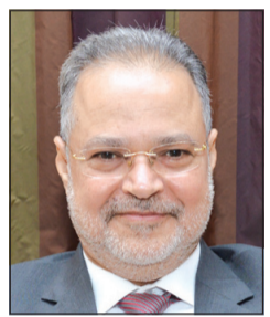
د. عبد الملك المخلفي

أكد نائب رئيس الوزراء ووزير الخارجية اليمني د.عبدالمك المخلفي أن زيارة الرئيس عبدربه منصور هادي إلى الكويت والتي سستبدأ اليوم وتنتهي يومين، ستكون تعبيرا عن شعور اليمن بالامتنان إلى الكويت أميراً وحكومة وشعباً على مواقفها الداعمة لليمن باستمرار، وخاصة في هذه المرحلة الصعبة، مضيفاً أن «الزيارة فرصة لتبادل الآراء بين الزعيمين وإطلاع صاحب السمو الأمير على كل المستجدات في اليمن وكل ما تحقق، إضافة إلى التنسيق في كل المواقع والقضايا ذات الاهتمام المشترك». وفي تصريح خاص لـ «الأنباء» خلال مكالمة هاتفية أشار المخلفي إلى أن الانقسامات بين الحوثيين وعلي صالح مستمرة، واصفاً العلاقة بينهما بـ «غرام أفاعي» لن ينتهي إلا بكارثة. • التفاصيل ص 8