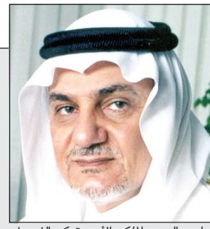
صاحب السمو الملكي الأمير تركي الفيصل

صاحب السمو الملكي الأمير تركي الفيصل: لا.. يا سيد أوباما 44