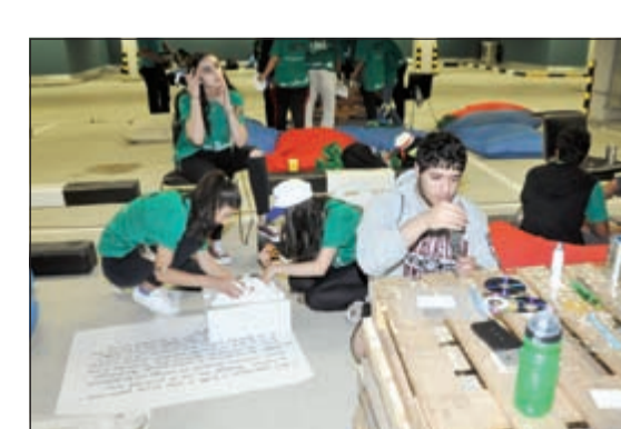
الطلاب خلال مشاركتهم بالمسابقة

هذا القطاع بقوة». وتقدمت الهاجري بشكر بنك الكويت الوطني على رعايته مسابقة «إيكو كويست» لإيمانه بالدور التربوي والاجتماعي والتعليمي والترفيهي الذي تطبقه لويك دائماً في جميع برامجها وحملاتها وبرامجها، قالت مسؤول العلاقات العامة في بنك