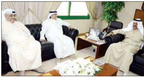
الشيخ احمد النواف مستقبلا صلاح المصنف