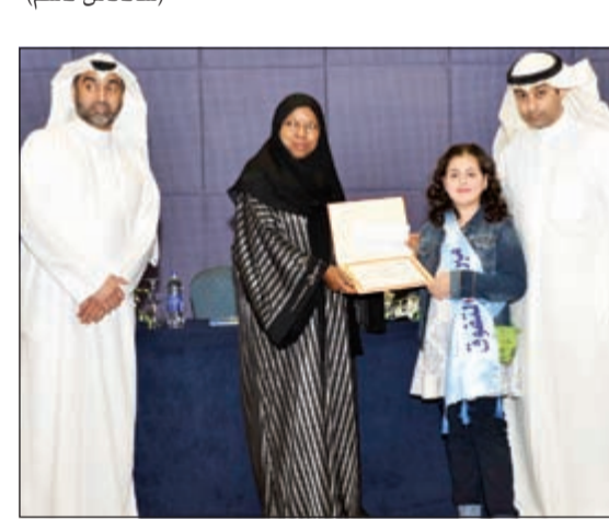
العنزي تكريم إحدى المتفوقات

الحفل رغم وجود ظروف ومعوقات من قبل البعض لإيقاف الحفل، ولكن أبيت على نفسي إلا إتمامه حتى ولو تطلب الأمر تحملي لكل المصاريف من جيب الخاص. وقالت: أشكر كل من وقف معي، كما أشكر كل من وقف ضدي فقد أعطاني العزيمة والإصرار لتكريم أبنائنا وإسعادهم. من جهته، قال أمين