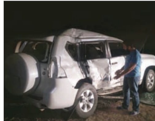
سيارة الجنود الأميركيين

وكان قد ورد بلاغ الى مخفر الجهراء بوقوع حادث سير مع إصابات شمال الكويت، على طريق العبدلي، طريق الرياح، وتبين ان الحادث عبارة عن تصادم بين جيب برادو تابع للجيش الأميركي مع باص نقل، وان هناك عدداً من المصابين وقد تم إسعافهم لمستشفى الجهراء بواسطة اسعاف 196 و267.