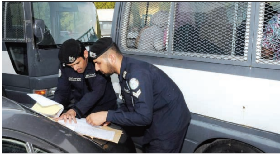
التدقيق على الأوراق الثبوتية للوافدين الموقوفين

للأدب العامة، بالإضافة إلى القاء القبض على شخصين. كما أسفرت حملة ثالثة شنتها وزارة الداخلية على منطقة الصليبية الصناعية واستمرت قرابة الساعتين في التدقيق على الأوراق الثبوتية لـ (1394) شخصاً، حيث تم تحويل (108) أشخاص منهم إلى إدارة الإبعاد والجهات المختصة، منهم (18) مخالفاً لقانون العمل و(33) مخالفاً لقانون الإقامة والعمل «تغيب» و(8) مطلوبين لأحكام قضائية مدنية وجنائية (22) شخصاً بدون إثبات وشخصان لحيازتهما مواد مخدرة و(15) شخصاً عمالة سائبة وثلاثة أشخاص بحالة سكر وشخصان لقيامهما بأعمال منافية للأدب العامة بالإضافة إلى القاء القبض على شخصين وضبط ثلاثة للمصلحة العامة، كما تم حجز 7 مركبات وضبط 4 مركبات أخرى مطلوبة.