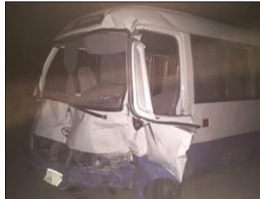
الباص بعد حادث التصادم

وكان قد ورد بلاغ الى مخفر الجهراء بوقوع حادث سير مع إصابات شمال الكويت، على طريق العبدلي، طريق الرياح، وتبين ان الحادث عبارة عن تصادم بين جيب برادو تابع للجيش الأميركي مع باص نقل، وان هناك عدداً من المصابين وقد تم إسعافهم لمستشفى الجهراء بواسطة اسعاف 196 و267.