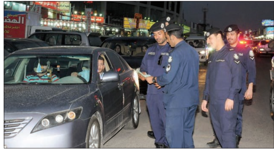
الحملة حصدت 271 عمالة سائبة وحررت مخالفات

المبدئية في وزارة الداخلية بقيادة وكيل وزارة الداخلية الفريق سليمان الفهد وبمشاركة القيادات الأمنية المختصة حملة أول من أمس شملت سوق الجمعة والإناث المستعمل