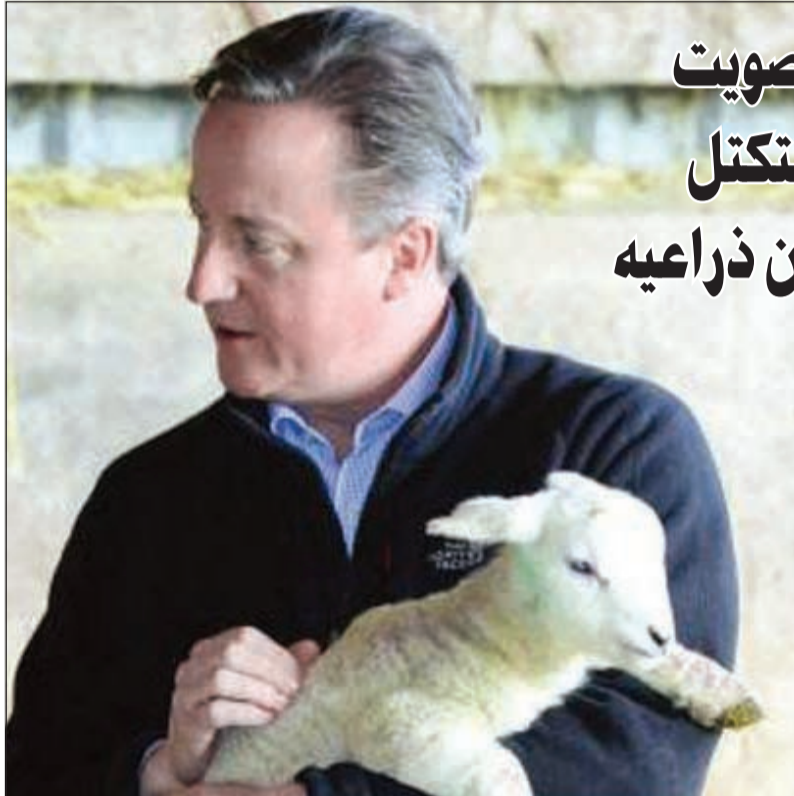
كاميرون يحمل حملاً خلال زيارته للمزارعين في ويلز

وكالات: نشرت وسائل اعلام امس الاول صورة لرئيس الوزراء البريطاني ديفيد كاميرون يحمل حملاً، خلال زيارة قام بها للمزارعين شمال ويلز. وحذر كاميرون من أن الانسحاب من الاتحاد الأوروبي قد يعرض الوظائف والاستثمارات في قطاع الزراعة البريطاني للخطر، مشيراً إلى أن المزارعين قد يخسرون نحو 330 مليون أسترليني نتيجة صادرات الضأن ولحم البقر فقط.