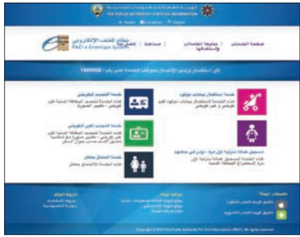
خدمات المغلف الإلكتروني

الأب. يذكر أن المغلف الإلكتروني الذي تقدمه الهيئة العامة للمعلومات المدنية عبر موقعها تم تطويره بحيث يتضمن العديد من الخدمات الإلكترونية منها: «تجديد الكويتي- تجديد غير الكويتي- استكمال بيانات مولود- تسجيل عمالة منزلية أول مرة- ومن في حكمهم- وأخيراً خدمة الالتحاق بعائل».