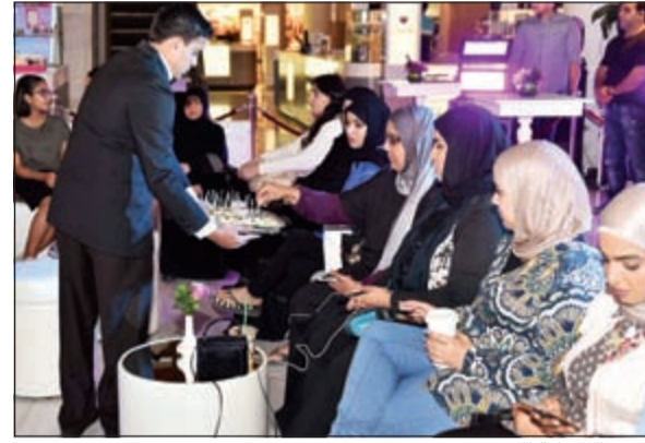
تقديم الضيافة للحضور

ويعد هذا الحدث الثاني على التوالي ضمن فعاليات «ليالي المرأة» التي تقام شهريا في «المهلب مول»، حيث تتم دعوة النساء بمختلف أعمارهن للمشاركة في هذه الأحداث المميزة التي تستضيف أهم الشخصيات العامة ومشاهير صفحات التواصل الاجتماعي في الكويت.