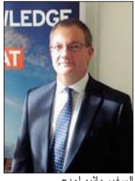
السفير ماثيو لودج