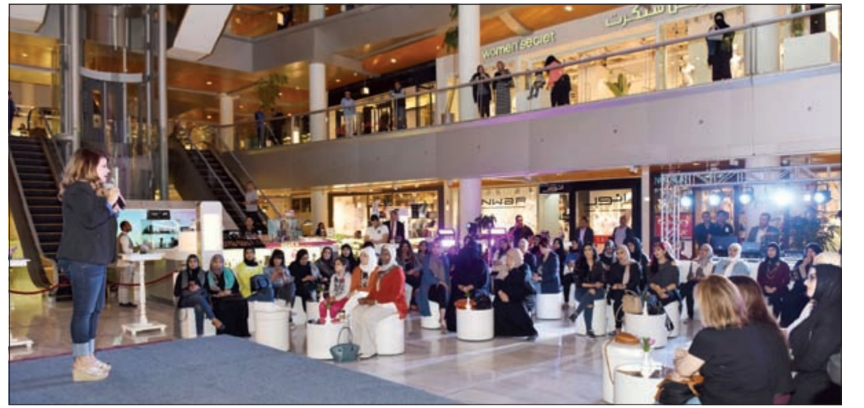
مناقشة مع الحضور

والى جانب العارضين، سيوفر المجلس الثقافي البريطاني موظفين مدربين للإجابة على الاستفسارات