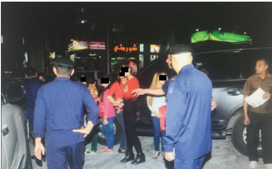
عدد من الموقوفين جراء الحملة التفتيشية المباعة في حولي

عن تحويل 1068 شخصاً الى إدارة الإبعاد والجهات المختصة من بين 3437 تم التدقيق على أوراقهم الثبوتية. وأكدت إدارة الأمن العام استمرار الحملات الأمنية المفاجئة على جميع المحافظات والعمل على تطبيق القانون وضبط كل المخالفين والخارجين عن القانون.