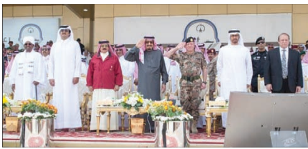
خادم الحرمين الشريفين الملك سلمان بن عبدالعزيز متوسلا عددا من القادة والزعماء خلال العرض العسكري لـ «رعد الشمال»

وقالت مصادر نفطية لـ «الأنباء» إن الرؤساء التنفيذيين للشركات النفطية سيقومون بسلسلة من اللقاءات مع الموظفين في الشركات النفطية خلال الأسبوع المقبل لإطلاعهم على قرارات خفض المزايا. وطمان وزير النفط بالوكالة أسد الصالح الموظفين عبر تغريدات على «تويتر» بأن ما يتداول في وسائل التواصل الاجتماعي عن تفاصيل اللقاء مع النقابات مغاير للحقيقة. وأعلنت مؤسسة البترول عن نقل وقائع اللقاء التوضيحي يوم غد لسلك الموظفين عبر بوابة النفط الكويتية. وفي أول تصريح له أعلن رئيس اتحاد عمال البترول والبتر وكيمويات سيف القحطاني لـ «الأنباء» رفضه القاطع للانقاص من حقوق ومكتسبات العاملين بالقطاع النفطي، مؤكدا ان اتحاد عمال البترول قادر على اتخاذ جميع الخطوات التصعيدية للحفاظ على حقوق ومكتسبات عماله الذين هم الثروة الحقيقية للكويت.