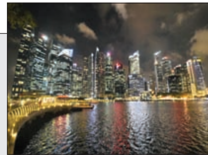
جانب من الحي المالي في سنغافورة