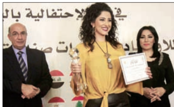
حنان مطاوع مكرمة

وشؤون المصريين بالخارج، د.غادة والي، وزيرة التضامن الاجتماعي، والإعلاميات شيريهان أبو الحسن، علا الشافعي، علا بكر، د.إيناس عبدالدايم، رئيس دار الأوبرا المصرية، والسفيرة هيفاء أبوغزالة، الأمين العام المساعد لجامعة الدول العربية، د.هند القاسمي، وسيدة الأعمال هبة السويدي، والشاعرة العراقية سارة طالب السهيل، والشاعرة الجزائرية حبيبة محمدي، والإعلامية الإماراتية رحاب زين الدين، والكاتبة الأردنية سلوى اللوياني، والإعلامية القديرة فضيلة توفيق الشهيرة بـ «أبلة فضيلة»، ومدعات أخريات في مجالات مختلفة ليصل عدد المكرمات في النهاية