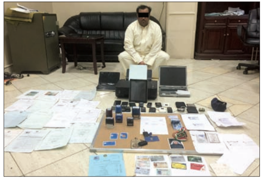
هويات متعددة باسمه لزوم جرائم «الانتحال»