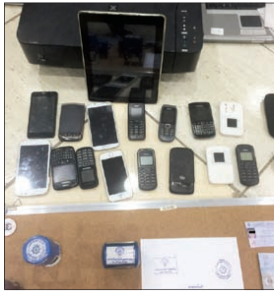
جانب من المسروقات التي عثر عليها رجال المباحث مع المتهم

نكرت الإدارة العامة للعلاقات والإعلام الأمني ان مقبلاً من الجنسية الأميركية تعرض للتعرض لاطر مشاجرة مع شخص آخر لدى تواجده بالواجهة البحرية في منطقة البنطاس، إذ هرب الجاني ثم سلم نفسه فيما بعد. وأوضحت الإدارة ان بلاغاً ورد الى غرفة العمليات يفيد بتعرض مقيم أميركي لعدة طعنات في مختلف أنحاء الجسم إثر مشاجرة بالقرب من الواجهة البحرية بمنطقة البنطاس، حيث توجهت الى المكان الأجهزة المعنية، وتم نقله الى المستشفى وحالته الصحية مستقرة. وأشارت الى ان الأجهزة المعنية باشرت