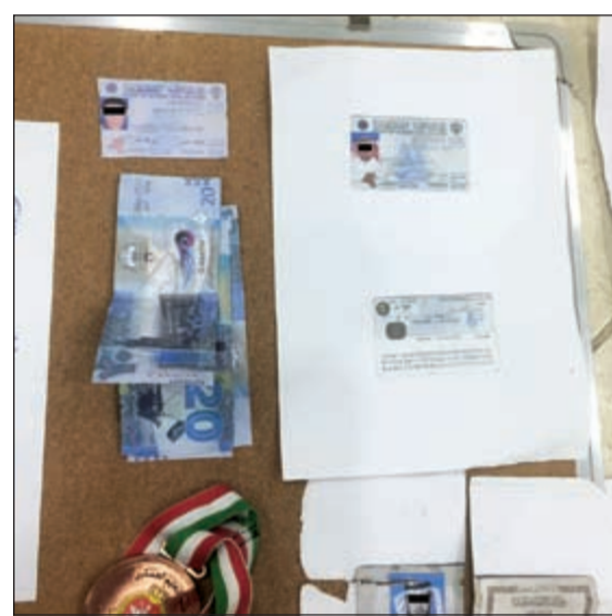
مبالغ مزورة من بين المضبوطات

عمليات السلب مركبته الخاصة وذلك في مختلف محافظات الكويت، ولقت السلي انه تبين انه محكوم عليه بالسجن لمدة ثلاث سنوات بتهمة التزوير في محررات رسمية. وأشارت الى ان الإدارة العامة للمباحث الجنائية بعد ورود معلومات عن قيام المتهم المذكور بعمليات التزوير قامت بتشكيل فرقة لضبطه حيث تم اتخاذ الاجراء القانوني اللازم وعقب ذلك قامت الفرقة بضبطه وتفنيته وعثر بحوزته على هويات عسكرية ومدنية وأوراق ومستندات رسمية مزورة