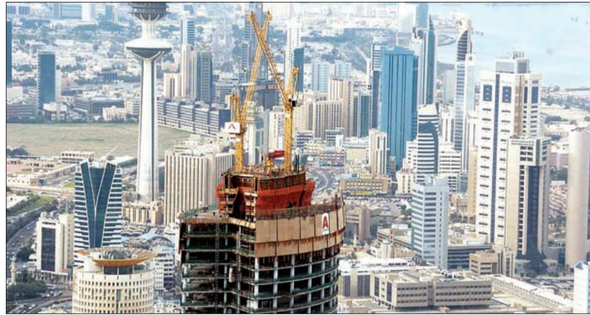
القلق مازال يسود سوق العقار مع استمرار تراجع أسعار النفط لفترات أطول

5% تراجع مبيعات القطاع السكني على أساس شهري