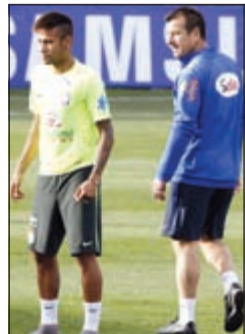
دونغا اختار نيمار للأولمبياد على حساب كوبا اميركا

رأى مدرب منتخب البرازيل كارلوس دونغا أنه سيختار نجم برشلونة نيمار للمشاركة في مسابقة كرة القدم في الألعاب الأولمبية المقبلة في ريو دي جانيرو على حساب كاس الامم الأميركية الجنوبية (كوبا اميركا). وتقام الدورة الأولمبية من 5 إلى 21 أغسطس، في حين تقام كوبا أميركا من 3 إلى 26 يونيو بمناسبة الذكرى الخموية لتطلاق البطولة القارية في أميركا الجنوبية. ومن الصعب مشاركة نيمار في المسابقتين خصوصا بعد موسم طويل في صفوف فريقه، لكن كون كوبا اميركا ضمن أجندة الاتحاد الدولي فيسكون برشلونة مضطرا لتحرير لاعبه للمشاركة في البطولة القارية.