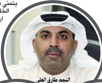
النجم طارق العلي