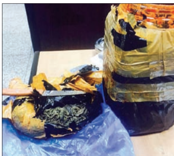
الماريغوانا التي ضبطت مع الآسيوي