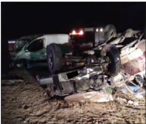
المركبة تهشمت تماما