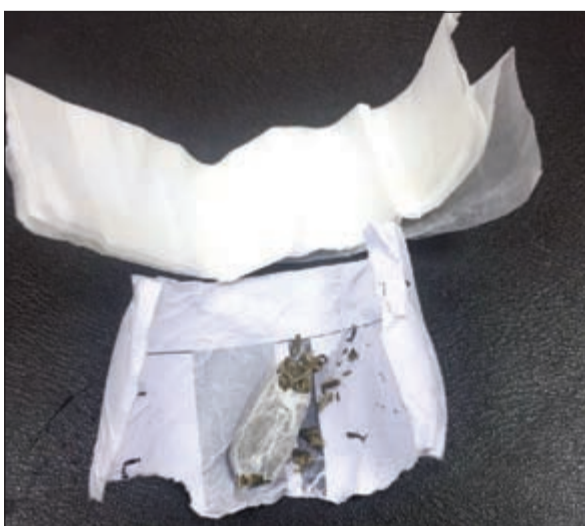
.. والمضيف وضع الماريغوانا في لفافة

فريق الجواله بقيادة مراقب جمارك المطار عيسى بن عيسى اشتبهوا في المضيف بعد هبوط رحلته، وبتفتيشه تم العثور على كمية من مادة الماريغوانا قام باخفائها في امتعته.