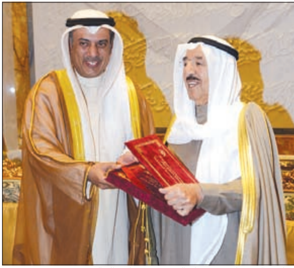
صاحب السمو الامير يتسلم التقرير من مهلهل الخالد