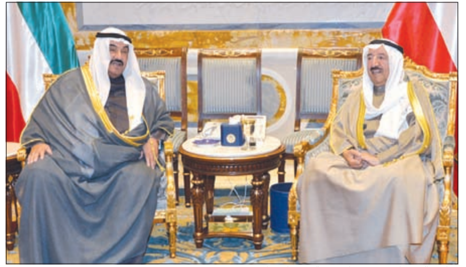
صاحب السمو الامير مستقبلا سمو الشيخ ناصر المحمد

كانت طيبة للغاية ونسعى إلى إرساء شراكة تتيح للشباب في الجامعات الحديث حول العمل الاجتماعي والتمويل المالي وجميع الأشياء التي أقوم بها لمعالجة القضايا التي أشارت إليها للتو». وأعرب عن سعادته لأنه أتاحت له الفرصة لمقابلة صاحب السمو الأمير والحديث مع سموه.