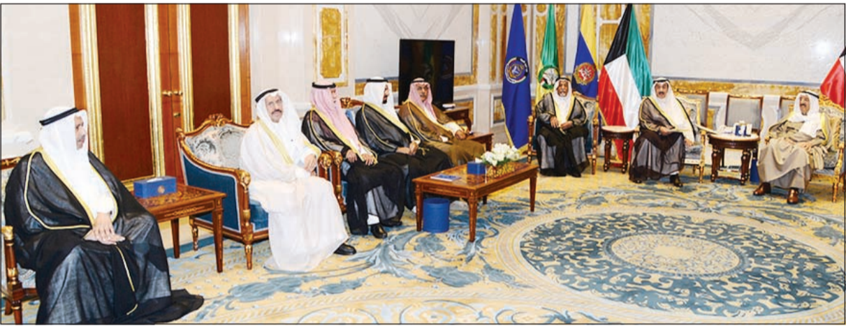
صاحب السمو الامير خلال اللقاء مع اهالي الجهراء