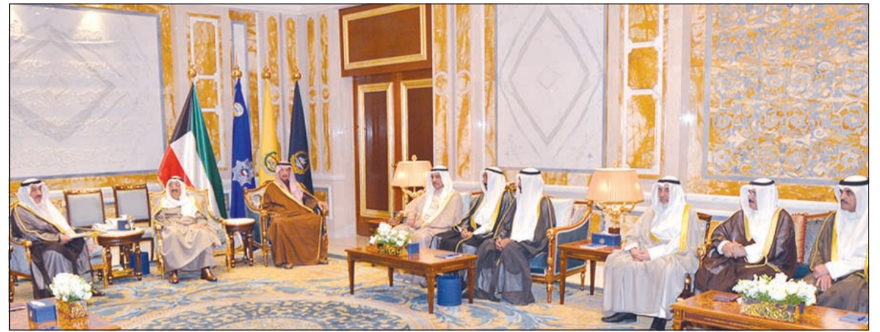
صاحب السمو الامير الشيخ صباح الاحمد خلال استقباله الفريق فهد الامير وعددا من اهالي الجهراء