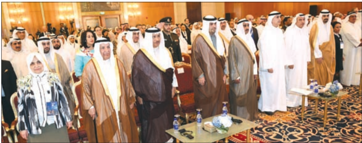
سمو رئيس الوزراء الشيخ جابر المبارك وكبار الحضور في افتتاح ملتقى الكويت للاستثمار