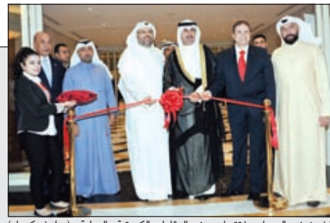
الشيخ نمر الصباح مفتتحاً معرض العقارات الكويتية الدولية (ريليش كويت)

نمر الصباح افتتح معرض العقارات الكويتية الدولية: «التجارة» تشكل «لجنة عقارية» تضم «الفرقة» و«العقاريين» والخاص» 40