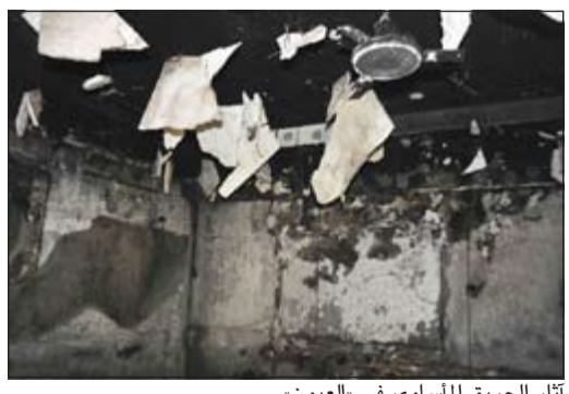
آثار الحريق المسائي في «العيون»

«العيون» تبكي طفلاً لقي حتفه في حريق ماساوي خلف 12 مصاباً