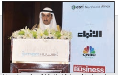
وزير التجارة والصناعة د.يوسف العلي يلقى كلمة افتتاح المؤتمر

نمر الصباح افتتح معرض العقارات الكويتية الدولية: «التجارة» تشكل «لجنة عقارية» تضم «الفرقة» و«العقاريين» والخاص» 40