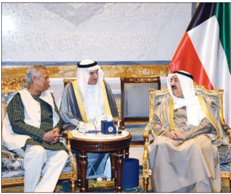
صاحب السمو الأمير الشيخ صباح الأحمد لدى لقائه البروفيسور محمد يونس

أشاد صاحب السمو الأمير الشيخ صباح الأحمد بالدور الذي تؤديه الجهات الحكومية المعنية وبجهود محافظ الجھراء والقائمين على المحافظة. جاء ذلك خلال لقاء سموه مع عدد من أهالي المحافظة الذين عبروا عن بالغ شكرهم وعظيم امتنانهم للرعاية السامية لصاحب السمو الأمير للمحافظة واهتمام سموه بإقامة المشروعات التنموية والحيوية فيها. من جهته، قال البروفيسور محمد يونس، الحاصل على جائزة نوبل للسلام عام 2006 ومؤسس بنك «جرامين» للفقراء: إن لقاءه صاحب السمو الأمير أسس كان طيباً للغاية، مشيراً إلى أن اللقاء تناول محاور «الأصفر الثلاثة»، والتي تعني: «لا فقير في العالم، ولا عاطل في العالم، ولا كربون في العالم». وأوضح أن سموه أشار إلى الجهود التي تبذلها الكويت من خلال الصندوق الكويتي للتنمية الاقتصادية العربية والجهات الأخرى، وسبل إبقاء الشباب خارج إطار البطالة، إضافة إلى سبل الحد من الفقر عبر الصندوق الكويتي. إلى ذلك يتفضل صاحب السمو الأمير الشيخ صباح الأحمد فيشتمل برعايته وحضوره حفل توزيع شهادات الإجازة الجامعية والدراسات العليا على خريجي الجامعة للعام الجامعي 2014/2015، وذلك في تمام الساعة العاشرة والنصف من صباح اليوم على مسرح المغفور له الشيخ عبدالله الجابر الصباح بمنطقة الشويخ. التفاصيل ص4