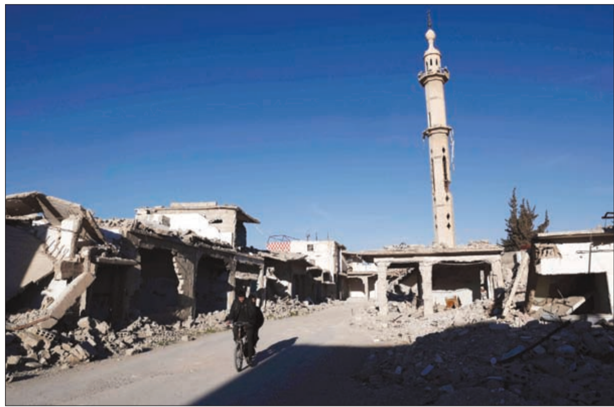
سوري يمشي وسط الدمار فيما غابت الطائرات عن السماء في دوما التي تسيطر عليها المعارضة

وعن تحفظات الهيئة السابقة على المشاركة في مفاوضات جنيف بسبب استمرار الخروقات للهدنة والتأخر في إيصال المساعدات الإنسانية إلى المناطق المحاصرة وعدم إطلاق سراح المعتقلين، قال نعسان آغا: «ربما لم يتحقق ذلك كله لكن الجهد يتابع بشكل حقيقي ونأمل أن يزداد