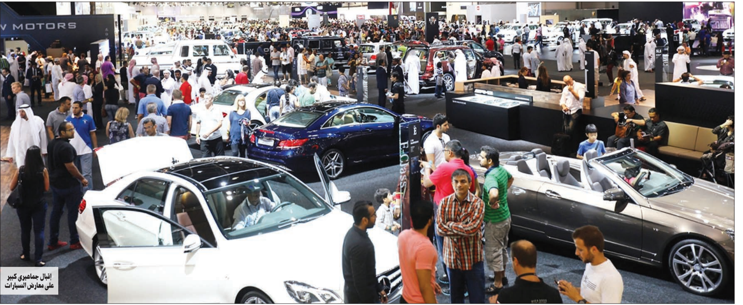
إقبال جماهيري كبير على معارض السيارات