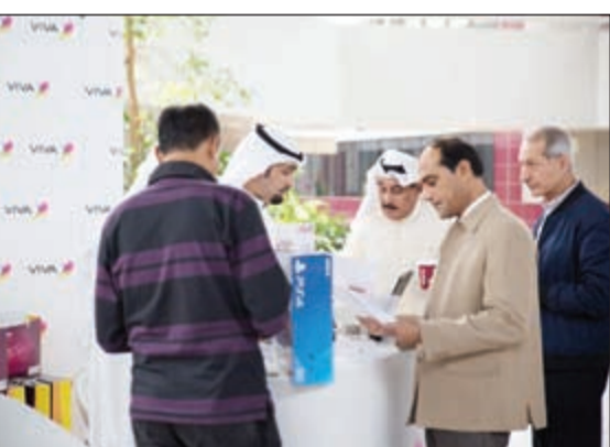
فريق VIVA خلال تواجدهم في مقر «الكويتية»

الجوية الكويتية تأكيداً على التزامها الدائم تجاه المجتمع والتواصل مع مختلف المؤسسات والهيئات في الكويت، للتعريف بمنتجاتها وخدماتها لتكون أكثر قرباً من عملائها، سعياً منها إلى تلبية كافة احتياجاتهم وتطلعاتهم. وتحرص VIVA دوماً على منح عملائها كل ما هو جديد وفريد في عالم الاتصالات حرصاً على نيل رضاهم وتحظى توقعاتهم كما تسعى إلى توفير أحدث الخدمات، في ظل شغفها وحرصها الشديد على تقديم خدمات مميزة لعملائها الكرام.