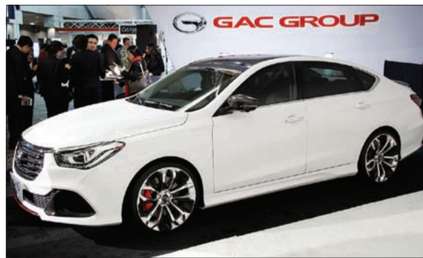
جي آيه سي GA6

والإمامية من شركة كونتيننتال الألمانية، والدعاميات الامامية والخلفية من شركة فيستون الأميركية، وناقل الحركة ذي السرعات الخمس من شركة ايسنر اليابانية، وتكييف الهواء من شركة دينسو اليابانية، وأحزمة الأمان والوسائد الهوائية والكوابح الخلفية ومنظومات القوة الهيدروليكية من شركة تي آر ديلبو الأميركية. وقالت المجموعة إن هناك العديد من العروض والمزايا التي تقدم للعملاء، وذلك تحت شعار «امتلك الفخامة الآن بأدق تفاصيلها.. واقبض لغاية 1000 دينار»، مع كفاءة طويلة مدتها 11 سنة، وصيانة لمدة 3 سنوات، وتقديم خدمة التسجيل والتأمين ضد الغير، مع تظليل حراري، وفوق كل ذلك جهاز أيفون S6.