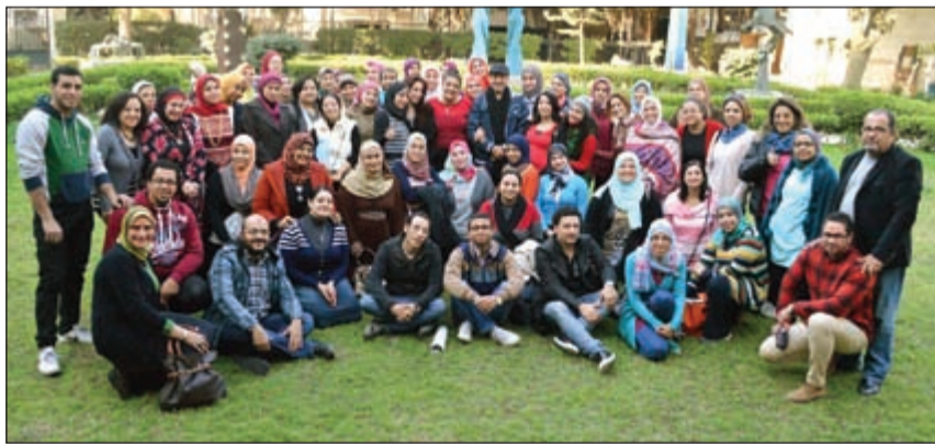
.. ومع متدربي ورشة الجزيرة للفنون - وزارة الثقافة - القاهرة

الورشة، تم تكريم الطالبة المشاركة، كما قام رئيس جامعة عين شمس د.عبد الوهاب عزت باستقبال الجابر في قصر الزعفران