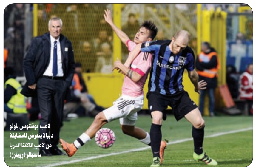
لاعب يوفنتوس باولو