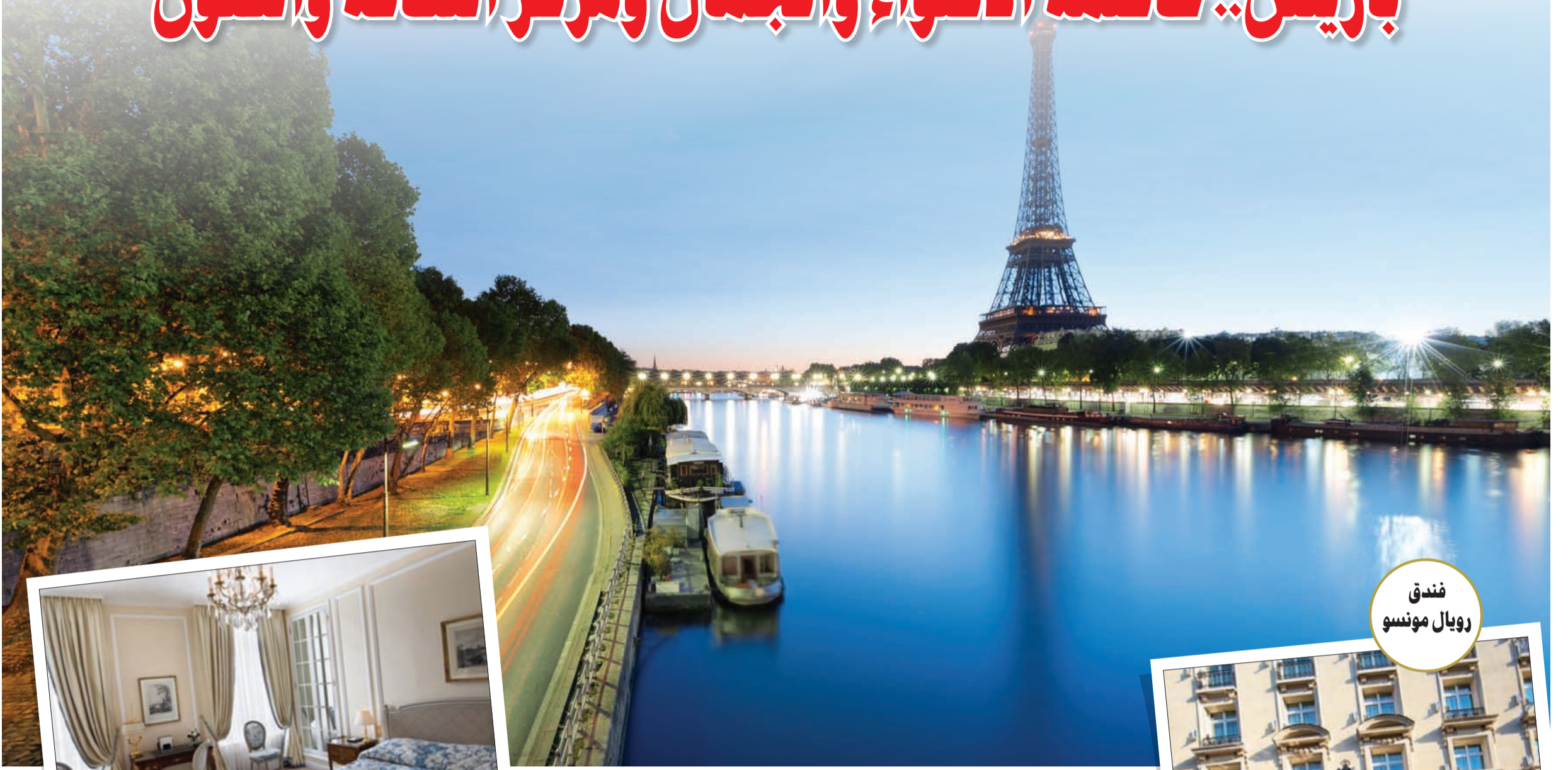
فندق رويال مونسو