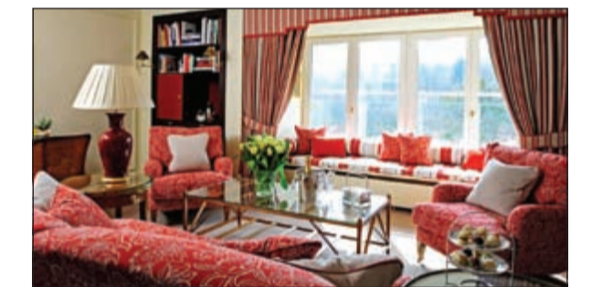
الغرف الفاخرة في فندق برنرز بادن بادن