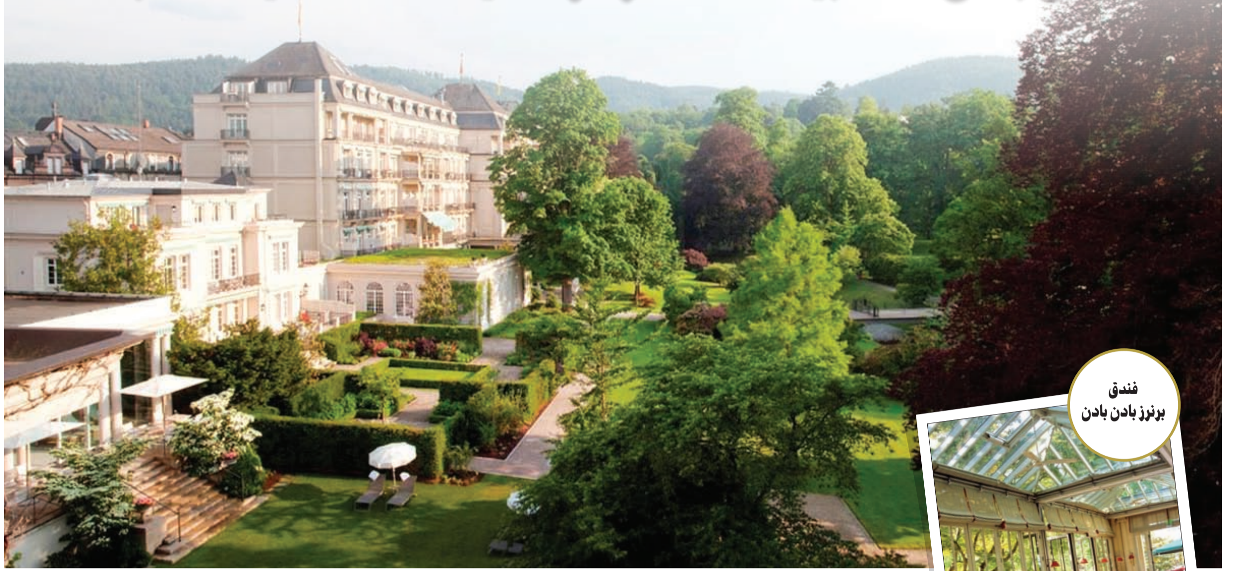
فندق برنرز بادن بادن