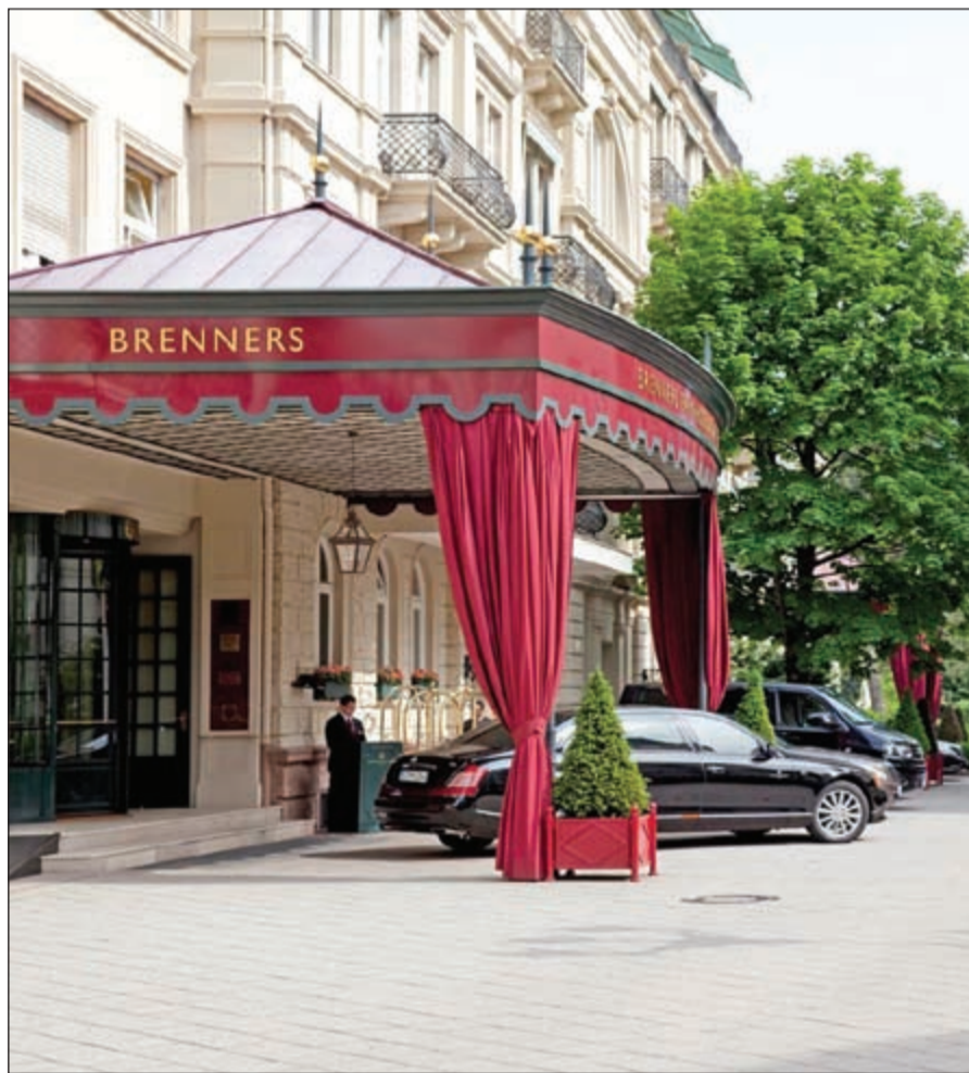
مدخل فندق برنرز بادن بادن

وإذا كانت بادن بادن ساحرة، فإن فندق برنرز بادن بادن Brenners Baden Baden هو قلب هذه المدينة ومن فخامتها، فهو الأفضل على الإطلاق، ولذلك لا عجب أنه مقصد الكثير من الملوك ورؤساء الدول والمشاهير وأثرياء العالم ممن يعرفون جيدا معنى أن يكون الفندق هو «الأفضل» بكل شيء، من أكبر الأساسيات إلى أصغر التفاصيل الدقيقة والتي تلبى متطلبات ومعايير «ذي ليدينغ هوتيلز»، الراقية. الفندق كان في الأساس قصرا، تم تحويله - مثل كل الفنادق التابعة لشركة «ذي ليدينغ هوتيلز» أوف ذا وورلد» - إلى فندق فخم، ثم جرى توسيعه بإنشاء «فيلا شتيفاني» Villa Stiphanie الذي يضم أجنحة بانخة الفخامة والجمال، بإطلالتهما التي تجعل الإقامة