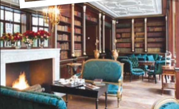
فخامة فندق لا ريزيرف بالوانه الهادئة

متطلبات كبار الشخصيات ممن يفضلون الخصوصية والأمان وأن لا يراهم أحد، فالفندق يوفر أجنحة منفصلة يمكن أن يشكل كل منها فندقاً خاصاً ومستقلاً بذاته، حتى خدمات الاستقبال فهي شخصية في كل جناح.