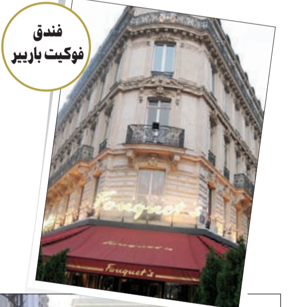
فندق فوكيت باربير