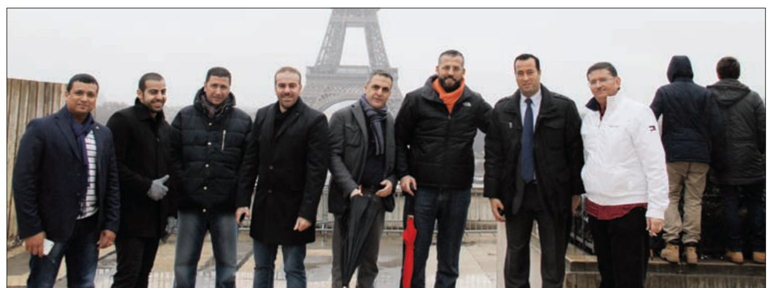
صورة جماعية لأعضاء الوفد أمام برج إيفل