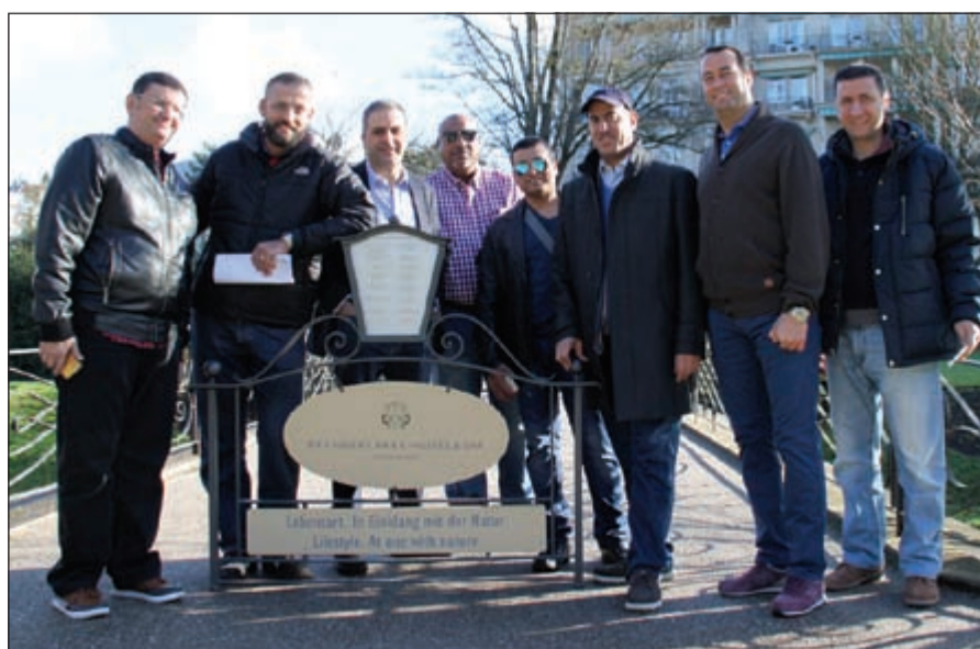
أعضاء الوفد أمام مدخل فندق برنرز بادن بادن