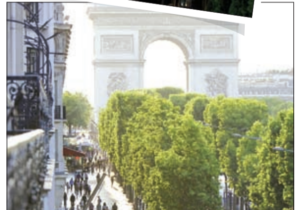
فندق فوكيت باربير وإطلالة جميلة على قوس النصر