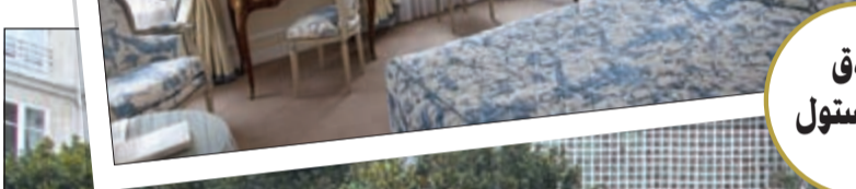
فندق لو بريستول