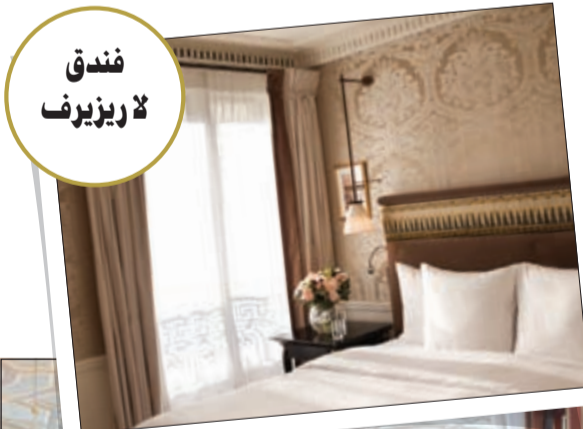
فندق لا ريزيرف