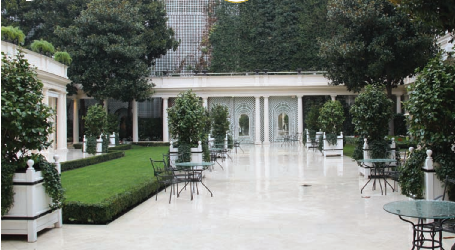
الحديقة الداخلية في فندق لو بريستول

باريس.. قلب أوروبا النابض بالحياة والفنون والجمال. لا عجب أنها ما زالت تحتل المركز الأول في قائمة الوجهات السياحية الأكثر تفضيلاً على مستوى العالم، فكل شيء في باريس ينطق، كل شيء حي، كل شيء في باريس يحمل طابعه الخاص من الجمال والأناقة والروعة.