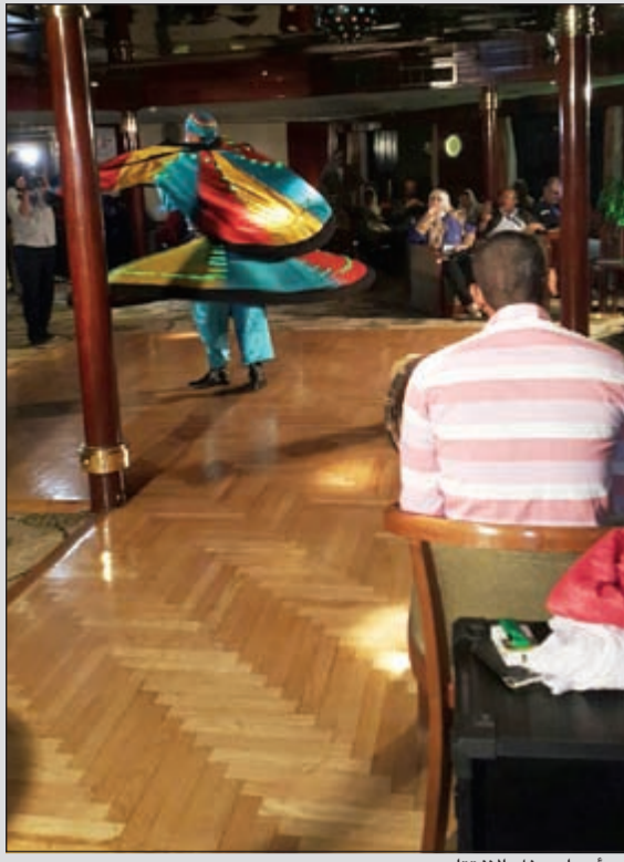
من أجواء حفل الافتتاح