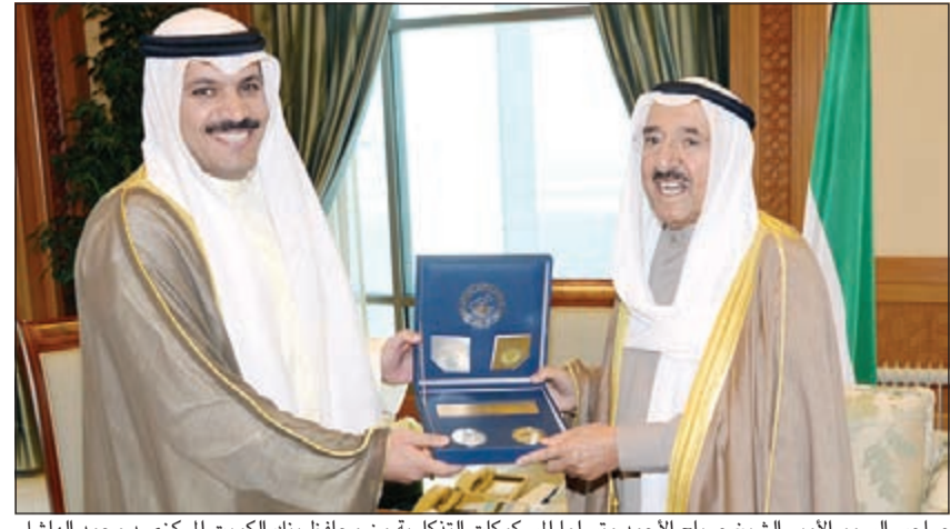
صاحب السمو الأمير الشيخ صباح الأحمد متسلماً للمسكوكات التذكارية من محافظ بنك الكويت المركزي د.محمد الهاشل