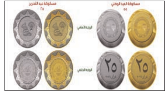
مسكوكات «المركزي»، بمناسبة الذكرى الـ 55 للعيد الوطني والـ 25 للتحرير

أصدر بنك الكويت المركزي مسكوكات تذكارية احتفالاً بالذكرى الخامسة والخمسين للعيد الوطني للكويت، والذكرى الخامسة والعشرين لتحرير الكويت (اليوبيل الفضي)، وذلك تعبيراً لما تحمله هاتان المناسبتان من معانٍ سامية وقيم وطنية. وقد جاء تصميم مسكوكات العيد الوطني بما يجسد هذه المناسبة العزيزة على قلوبنا جميعاً، حيث تحمل الإصدارات (الذكرى الخامسة والخمسون للعيد الوطني للكويت) باللغة العربية، وتشكيلة نصف دائرية من التصاميم الزخرفية، وكذلك شعار الدولة الرسمي وشعار بنك الكويت المركزي، وعبارة (بنك الكويت المركزي) بالإنجليزية العربية والإنجليزية، وقيمة رمزية (ليست سعر البيع) 5 دنانير.