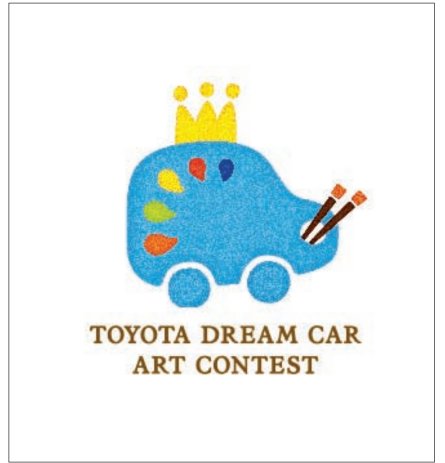
شعار سيارة الأحلام