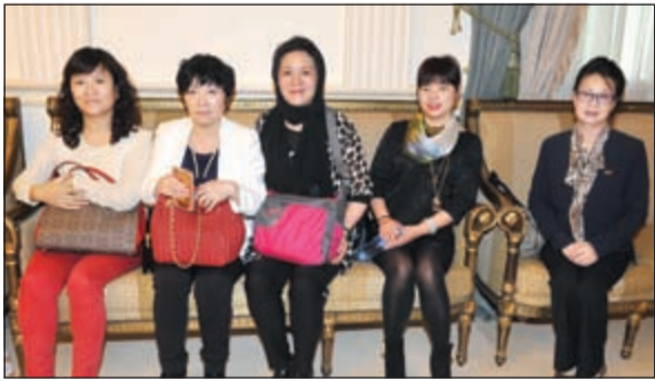
حضور نسائي مع الوفد الصيني

وأشار تشين إلى أن الرئيس الصيني حدد ملامح العلاقات الصينية - العربية وحرص بلاده على تطويرها في خطابه في الجامعة العربية، معربا عن أمله في أن تساهم مثل هذه اللقاءات في فتح آفاق جديدة من التعاون بين البلدين، موضحا أن الوفد يتكون من 18 عضوا يمثلون جهات قطاعات استثمارية مختلفة منها الزراعة ومستلزماتها والكمبيوتر والأجهزة الكهربائية والأطعمة الحلال.