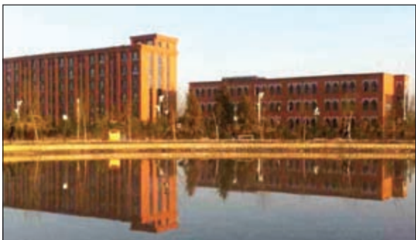
معهد اللغات العالمية في مقاطعة نينغشيا