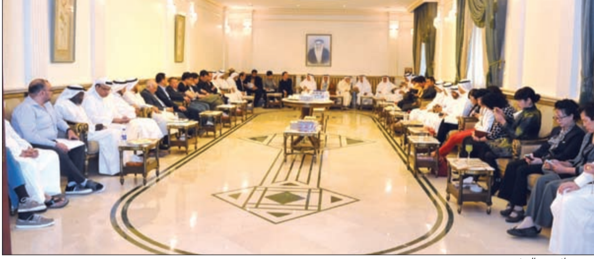
جاناب من الحضور