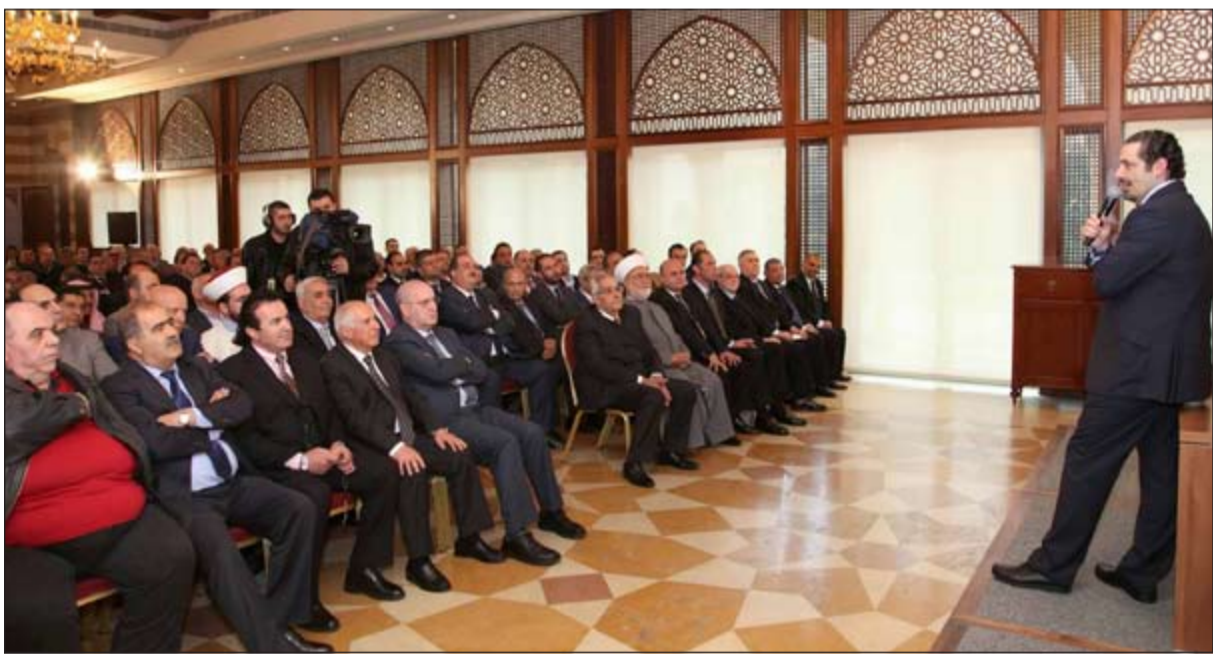
الرئيس سعد الحريري خلال استقبالاته وفودا من بيروت والبقاع في بيت الوسط

العودة إلى «المطامر الصحية» قد تنفذ حكومة سلام لبنان: زيارة باسيل «بيت الوسط» تخرق السكن الرئاسي