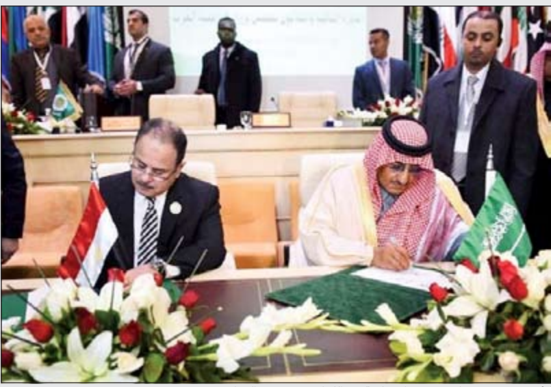
الأمير محمد بن نايف يوقع الاتفاقية مع اللواء مجدي عبدالغفار