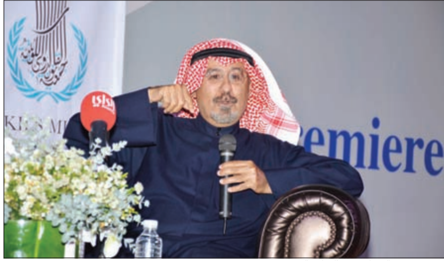
الشيخ د.محمد الصباح متحدثاً خلال الندوة

فتح مجال الأسئلة للطلبة والطلاب، فسألوا الشيخ د.محمد الصباح عن قبوله منصب الأمين العام لجامعة الدول العربية أو منصباً في الحكومة الكويتية، فرد قائلاً: «لا سأعتمد عنهما، دون ذكر الأسباب».