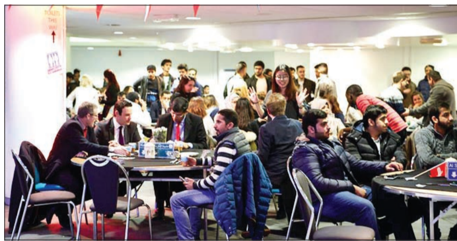
جانب من الحضور في الاحتفال