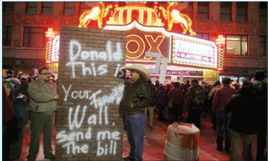
متظاهرون ضد المرشح الجمهوري المحتمل دونالد ترامب في مدينة ديترويت بولاية ميشيغان امس الاول

كما تعرض «المتطرف» ترامب خلال مناظرة متلفزة لهجمات مكثفة من منافسيه في الانتخابات التمهيدية وأيضاً من شخصيات من الحزب باتت تخوض حرباً مفتوحة ضده.