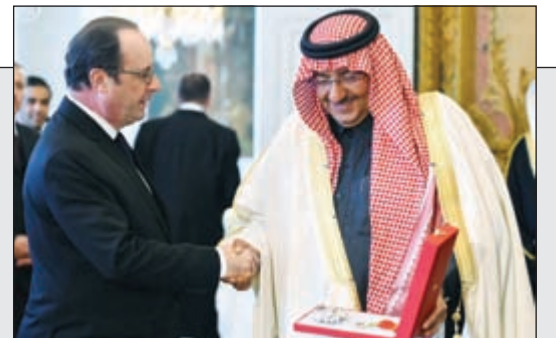
الرئيس الفرنسي فرنسوا هولاند يقبل صاحب السمو الملكي الأمير محمد بن نايف ولي العهد نائب رئيس مجلس الوزراء وزير الداخلية السعودي وسام جوقه الشرف الوطني

عبدالمحسن الحرمر: جدي اشترى بيننا القديم من «مبارك الكبير» بـ400 ريال عام 1906