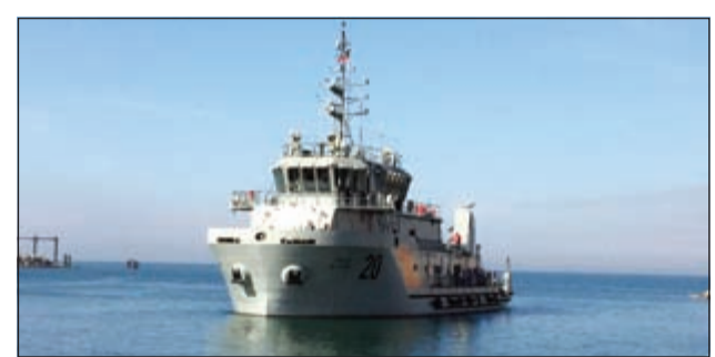
سفينة «السلام» 20

«السلام» 20 تنضم إلى أسطول خفر السواحل والسيف 30 والجليعة 40 منتصف العام الحالي