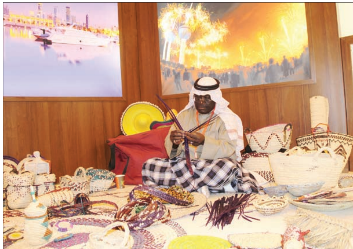
«سفن الخوص» من تراث الكويت

لمدة ساعتين يترك بعدها تحت أشعة الشمس ليجف وتصيح أوراقه جاهزة للصف. والطعام من أهم منتجات الخوص وتكون عادة كبيرة الحجم ومستديرة الشكل إذ يصل قطرها إلى أربع أقدام وتحتاج الخوص والكمية على الحجم المطلوب للسفرة والتي كانت تصنع بجودة تسمح لنفسها بمياه البحر المالحة دون أن تتلف كما كانت تستخدم في تحفيف الروبيان والجراد وبعض الأعشاب. ومن أشهر منتجات الخوص أيضاً لدى أهل الكويت (المهفة) أو المروحة البدوية التي كانت تستخدم في فصل الصيف لتحريك الهواء أمام وجه مستخدمها لمنحه شعوراً بالبرودة كما تستخدم في زيادة الهواء على المواقد التي تستخدم الفحم أو الحطب لزيادة اشتعالها وهي ما زالت مطلوبة حتى اليوم لهذا الغرض في الرحلات والبرية والمزارع والشاليهات. ولم يكن البيت الكويتي