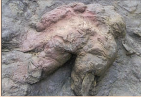
أحفورة عظام الأفيال المنقرضة كما عثر عليها