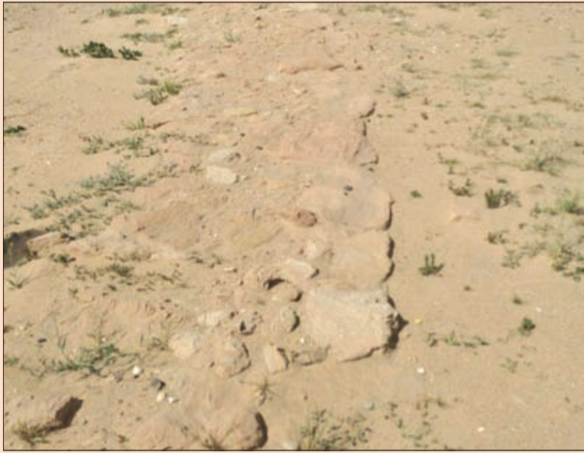
المنطقة التي تم فيها اكتشاف العظام