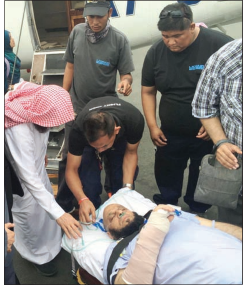
الشيخ عائض القرني أثناء نقله للطائرة

مانيلابالغربية: وجه الداعية السعودي الشيخ عائض القرني رسالة مصورة إلى محبيه ومريديه في العالم العربي والإسلامي من أحد مستشفيات مانيلابالغربية، يبشروهم بأنه بصحة وعافية بعد تعرضه لحادث إطلاق نار من قبل بعض الأشخاص مساء الثلاثاء الماضي.