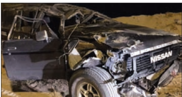
إحدى السيارات محطمة تماما