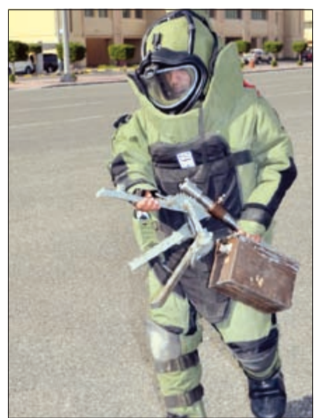
استعداد تام للتعامل مع المتفجرات