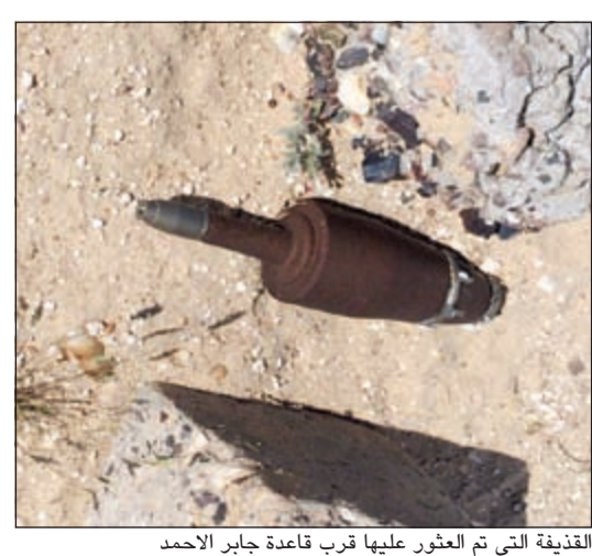
القذيفة التي تم العثور عليها قرب قاعدة جابر الأحمد

قام رجال هندسة المتفجرات بنقل قذيفة عثر عليها قرب قاعدة جابر الأحمد العسكرية، وقال مصدر أمني ان بلاغا ورد من مواطن شاهد جسما غريبا اعتقد أنه لغم. وبعد وصول رجال هندسة المتفجرات، اتضح ان هذا الجسم الغريب قذيفة من مخلفات الاحتلال. ومن جهة أخرى عثر على لغم في بر الصبية الواقع بالقرب من جسر الصابرية. كما عثر على لغم آخر بالقرب من طريق الأبرق على طريق السالمي.