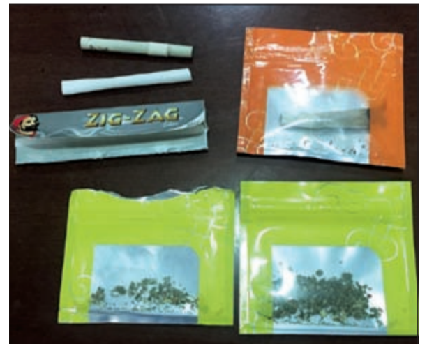
الكيميكال التي تم التحفظ عليه

شن رجال أمن العاصمة حملة موسعة على عدد من