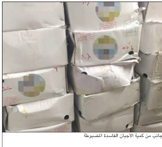
جانب من كمية الأجناب الفاسدة المضبوطة

أعلنت المؤسسة العامة للرعاية السكنية أن نسبة القسائم الحكومية في مشروع جنوب المطلاع الإسكاني التي تم توزيعها بلغت 85,5% من العدد الإجمالي وهو (12177) وحدة سكنية للسنة المالية استكمالا للخطة الإسكانية قصيرة الأجل للسنة المالية 2016/2015. وقالت المؤسسة في بيان صحفي أمس: إن إجمالي القسائم الحكومية التي تم توزيعها على المواطنين أصحاب الطلبات الإسكانية الذين وردت أولويتهم التاريخية على مشروع جنوب المطلاع الإسكاني حتى اليوم بلغ (10420) قسيمة حكومية. وأضافت أن ما تبقى من الدفعات سيتم الإعلان عنها وتوزيعها وفقا لجدول التوزيعات للسنة المالية ليكون المتبقى من القسائم الحكومية بالمشروع (1757) قسيمة.