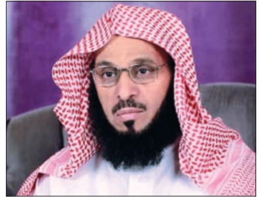
الشيخ عائض القرني

بأمر ملكي.. طائرة خاصة لنقل القرني إلى السعودية