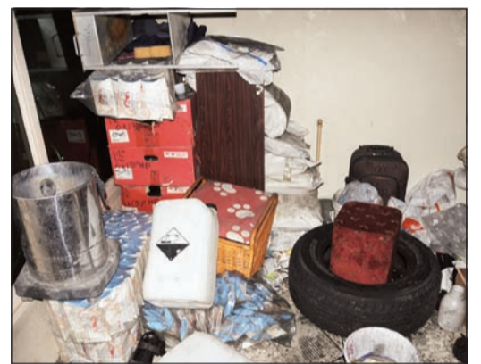
المواد الخطرة التي عثر عليها رجال الإطفاء

تمكنت فرقنا إطفاء القربين ومبارك الكبير للمواد الخطرة من إخماد حريق اندلع في سرداب منزل بمنطقة جابر العلي مساء أمس، حيث قامت الفرقتان بالسيطرة على الحريق قبل انتشاره وأثناء المكافحة وجد جرائل عليها إحدى علامات المواد الخطرة، وتم التعامل معها مع المواد المشتبه بها من قبل فرقة مبارك الكبير للمواد الخطرة وتأمين الموقع ولم تقع إصابات بشرية.