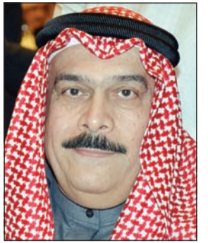
المستشار نصر سالم آل هيد

أيدت محكمة الاستئناف برئاسة المستشار نصر سالم آل هيد حكم الجنابات بحبس 3 مواطنين، أحدهم موظف في إدارة التنفيذ والآخر في وزارة المواصلات، 15 سنة مع الشغل والنفاذ مع العزل من الوظيفة وإلزامهم متضامنين برد مبلغ 470 ألف دينار وتغريمهم 940 ألف دينار. ووجهت النيابة العامة إلى المتهمين الأول والثاني بصفتيهما موظفين عموميين في إدارة تنفيذ حولي والثاني في وزارة المواصلات