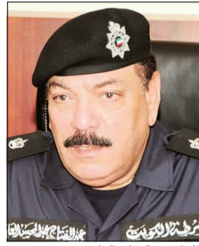
اللواء عبدالفتاح العلي

بجميع مديريات الأمن التابعة لقطاع شؤون الأمن العام. ولأهمية دور الدوريات الامنية في نقاط الانتشار الامني وفرض السيطرة الامنية بضرورة تواجدها في مناطق الواجب على مدار الساعة، وعليه على السادة مديري الأمن العامين الإيعاز لمن يلزم (قيادة المناطق - رؤساء المخافر) بتسلم جميع الأشخاص المحالين من قبل دوريات الأمن العام (سرية المحافظة) - دوريات اسناد المحافظة) والمطلوبون للمخافر يتم تسليمهم لمخفر المنطقة