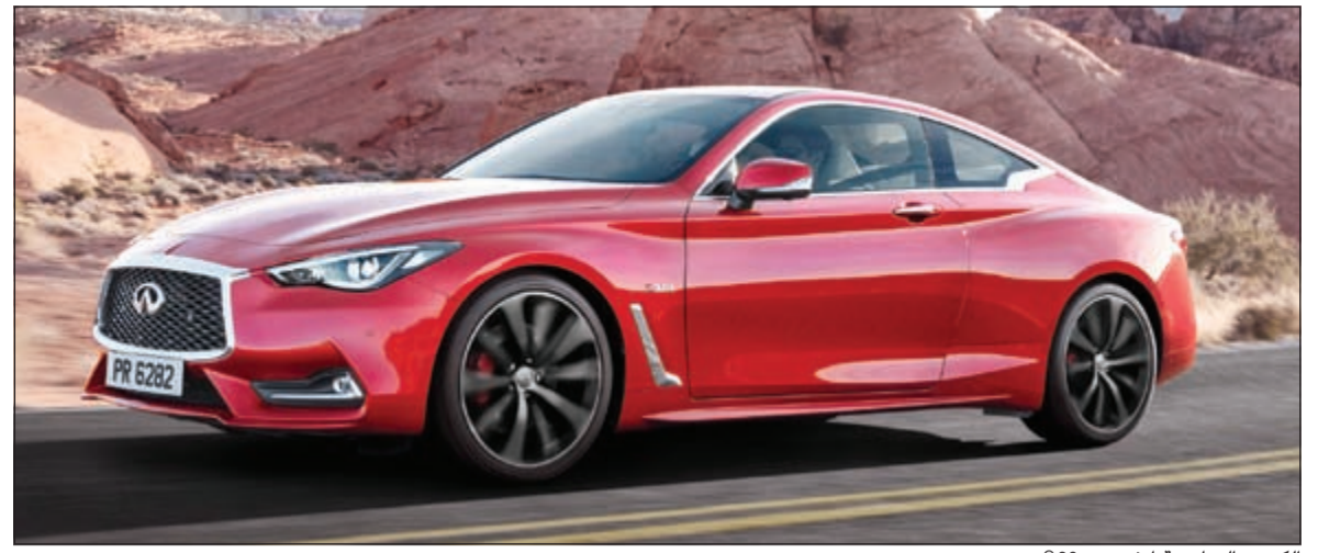
الكوبيه الرياضية إنفينيتي Q60