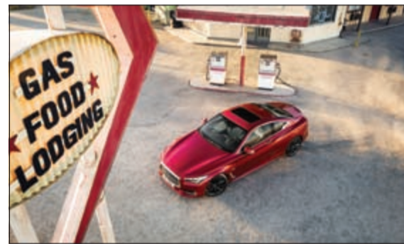
إنفينيتي Q60 تقدم متعة قيادة مفعمة بالقوة

بعد أن اعتاد عملاء هيوونداي «شمال الخليج» على التمتع ببارقي العروض الحصرية والحملات التسويقية التي تنفرد بإطلاقها تقديراً لعملائها الأوفياء ومحبي سيارات هيوونداي الزاخرة بالأداء الفعال والاعتمادية الطويلة، تعود «شمال الخليج» مؤخرًا لتطلق عرضاً استثنائياً وغير مسبوق تحت شعار التسويقي «امسح والكل يربح».