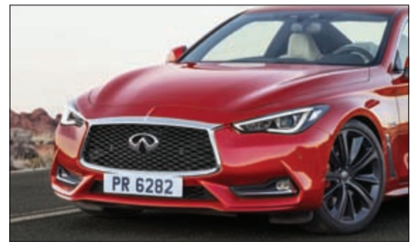
إنفينيتي Q60 تقدم متعة قيادة مفعمة بالقوة

والمقصورة الداخلية التي تشبه مواصفات السيارة التجريبية، والتصميم غير المتماثل للمقصورة الداخلية. وتتضمن Q50 السيدان الرياضية مجموعة الطرازات الجديدة، وقد خضعت لترقيات بارزة لتعزيز الأداء والمزايا الدناميكية ما يوفر للمعلاء تجربة قيادة أكثر قوة وروعة. وقال رولاند كروجر، رئيس شركة إنفينيتي موتور المحدودة: «كان 2015 عاماً ناجحاً لشركة إنفينيتي، فقد حققنا تحولاً هائلاً في مجموعة منتجاتنا وسجلنا من الأرقام القياسية في المبيعات العلامة التجارية حول العالم. وتؤكد الثلاث