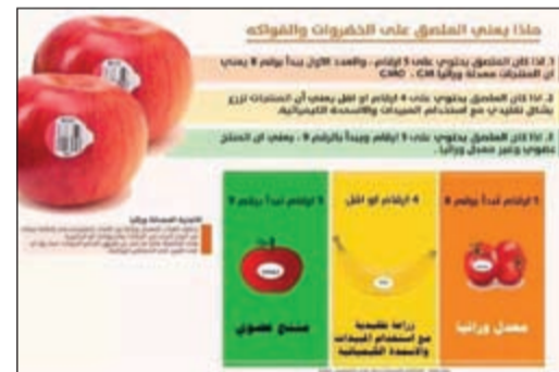
رسم توضيحي للملصقات على الخضار والفاواكه

عندما نرى ملصقات وضعت على الفاكهة أو الخضار فهذا يعني أن هناك معنى لها، وغالبا ما يجهل الكثيرون الأرقام الموضوعة عليها، فإذا كان الملصق يحتوي على 5 أرقام، والعدد الأول يبدأ برقم 8 فهذا يعني أن المنتج معدل وراثيا GM، GMO.