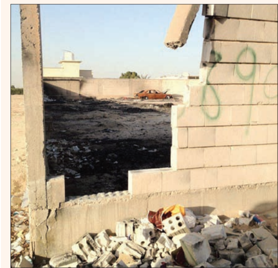
سور محطم ومهمل