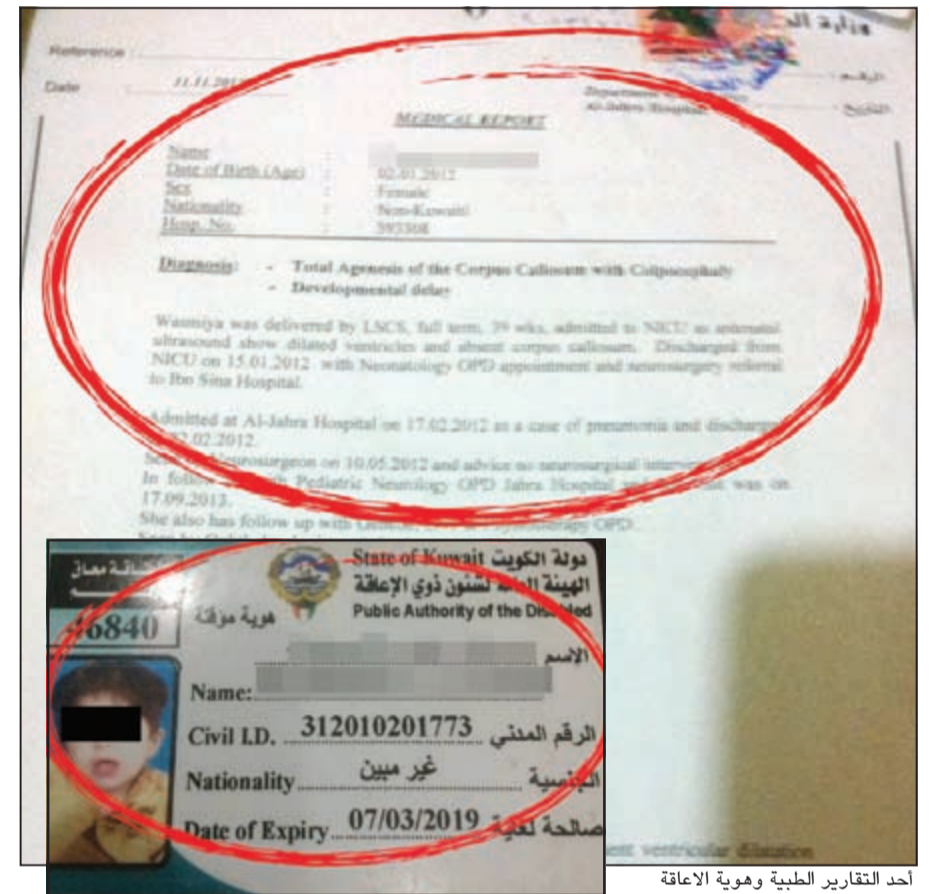
أحد التقارير الطبية وهوية العاقلة

● إخوانك العاملين بالأندية المدرسية المسائية