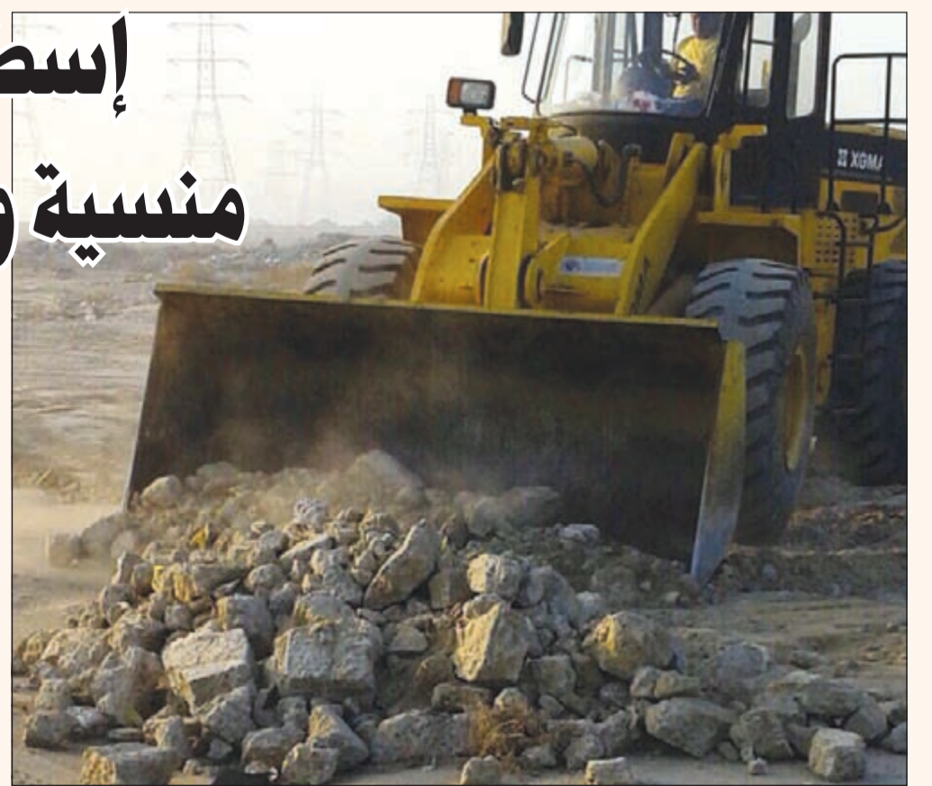
بلدوزر يزيل أنقاض أحد الجواخير

رغم عمل بلدية الأحمدية في بر اسطبلات الهجن الواقعة في كبد بين حين وآخر، إلا ان الجهد يجب ان يتضاعف لما تحمله الاسطبلات من أهمية خصوصا في فصل الصيف الذي يتجه فيه معظم الشباب الى الاسطبلات في جميع الأوقات، خصوصا في الفترة المسائية وقد وصلت الينا عدد من الصور التي توضح ان الأتربة تحتاج بعض الطرق وغير ذلك، فهناك أنقاض ومخلفات وسيارات محروقة قد تكون مسرقة. أهالي ومرتاو اسطبلات الهجن يناشدون البلدية إزالة الأتربة والأنقاض، بالإضافة الى تكثيف الدوريات للحد من السرقات التي تتعرض لها الجواخير من دواجن وطيور بلديل تسجيل القضايا في مخفر المنطقة. ويعتقد الأهالي انه اذا تم التعاون بين بلدية الفروانية والجهراء والأحمدية فسيكون الانجاز أضعاف ما هو حادث اليوم، لذلك يرجون الانتباه الى اسطبلات الهجن المدفونة.