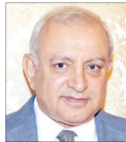
د. بدر العيسى

الحادة واستمرت فترة العلاج ولم يكن لدي أي مجال لمراجعة الجامعة، ولدي كل الأوراق التي تثبت كلامي. علما بسان والدتي كويتية الجنسية وبالتأسيس وكلي أمل ورجاء في أن أعود إلى الجامعة لاستكمال دراستي خاصة ان امامي سنة واحدة فقط على التخرج، وارجو أن يلقي طلبي القبول لدى الوزير د. بدر العيسى حتى أعود لمقاعد الدراسة وأرفع رأس بلدي المعطاء الذي ولدت وتربيت فيه.