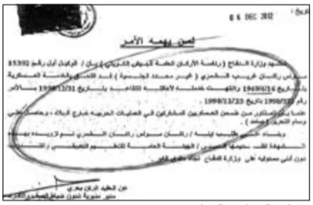
شهادة التحاق بال دفاع