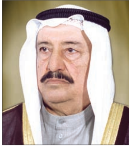
سمو الشيخ سالم العلي

إلى نائب رئيس الوزراء ووزير الداخلية الشيخ محمد الخالد الصباح، أتقدم إليك بصفقتك رمز الأمن والعدل في البلاد وبشخصك العادل وسمعتك الزكية الفذ الغيور وانت الأب للجميع. وما أصبحت يا سيدي بهذا المنصب إلا وانت كفو له وموافق سابقا في وزارة الداخلية وحاليا مميزة ونادرة ولك بصمة وتميز فيها. هذا بعض الأبيات مني أنا الأب المنفجع بابني شارحا فيها ما جرى، وأسأل الله ان يلهمني الصبر وان ياجرك في مساعدتي. وأقول فيها: