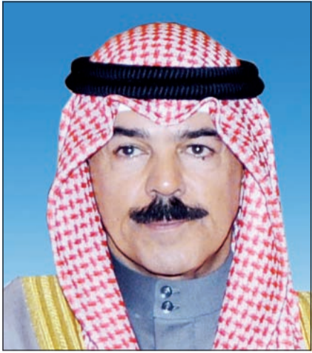
الشيخ محمد الخالد

آخر الأخبار المحلية زوروا موقعنا على www.alanba.com.kw/Local