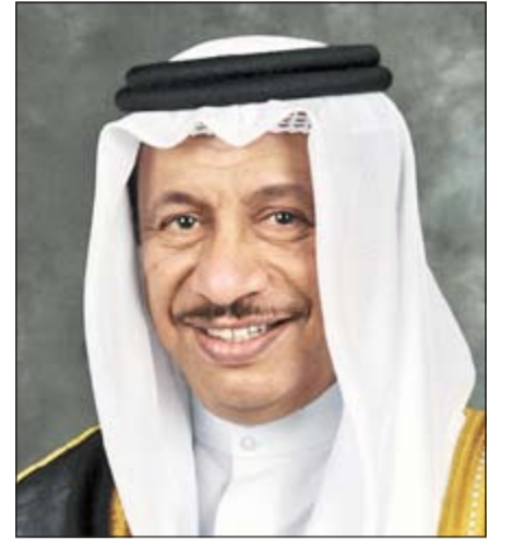
سمو الشيخ جابر المبارك

أستغيث بسمو رئيس مجلس الوزراء، بإرسال ابنتي المعاقة للعلاج بالخارج، حيث إنها تبلغ من العمر 4 سنوات، وتعاني من رخاوة بالأعصاب وضهور بالبخ، حيث إنني من فئة البدون، ولا أستطيع أن أتحمّل تكاليف علاجها، ولدي التقارير الطبية التي تثبت حالتها المرضية، راجين من الله ومن ثم سموكم بإرسالها للعلاج، وجزاكم الله عنا خير الجزاء.