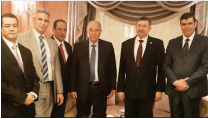
وزير العدل المصري المستشار احمد الزند والمستشار محمد الذهبي وعدد من القضاة المصريين بالكويت