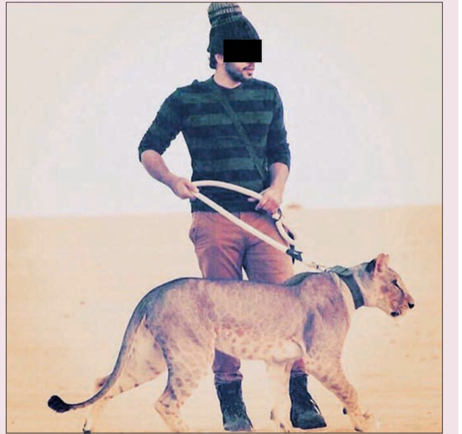
الشاب السعودي صديق المواطن الكويتي الضحية يروض اللبؤة القاتلة