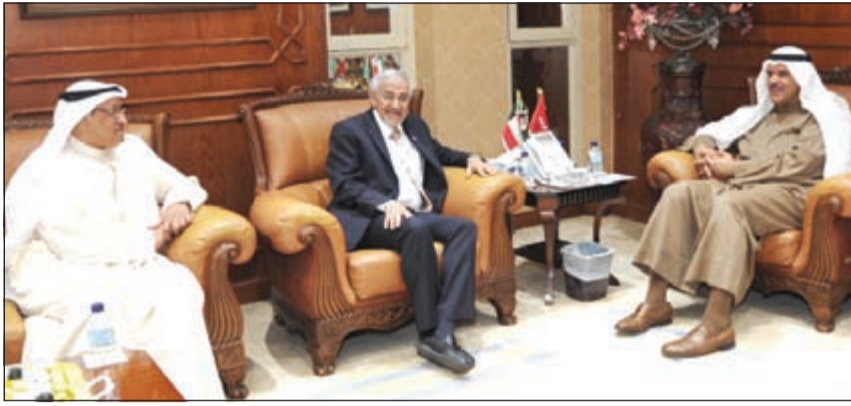
الشيخ سلمان الحمود خلال لقائه رئيس مجلس إدارة الجمعية د. هلال السايير وأنور الحساوي

أشاد وزير الإعلام ووزير الدولة لشؤون الشباب الشيخ سلمان الحمود بالدور الكبير الذي تقوم به جمعية الهلال الأحمر الكويتي في مجالات العمل الإنساني والخيري. وقالت وزارة الإعلام في بيان صحفي أمس أن الشيخ سلمان الحمود التقى رئيس مجلس إدارة الجمعية د. هلال السايير ونائب رئيس مجلس الإدارة أنور الحساوي حيث أعربا عن الشكر للشيخ سلمان الحمود على الدور الذي قامت به وزارة الإعلام في إبراز جهود الجمعية وكذلك إبراز توزيع المعونات على مخيمات اللاجئين السوريين في كل من الجمهورية اللبنانية والمملكة الأردنية الهاشمية وأيضا على النازحين في جمهوريتي العراق واليمن. وذكر البيان أنهما قدما للوزير نسخة من كتاب يوثق مسيرة 50 عاما على تأسيس جمعية الهلال الأحمر الكويتي.