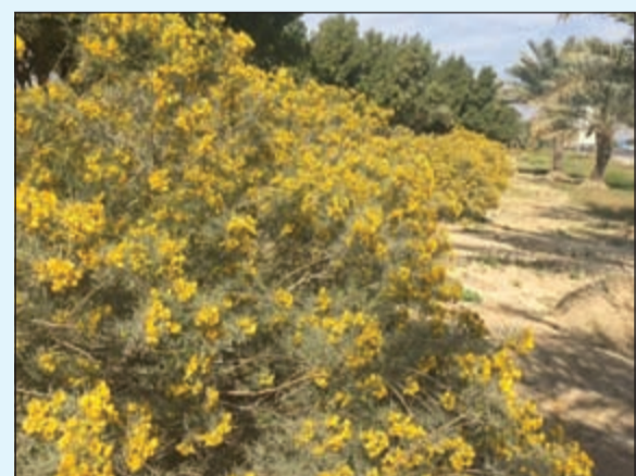
زراعة 581 طريقا وشارعا رئيسيا

78 ألف متر مربع. وبين أن الهيئة تقوم كذلك بالتنسيق مع بلدية الكويت لتسلم وتثبيت 67 موقعا جديدا يتم تخصيصها كحدائق عامة. وأشار إلى أن الهيئة تبذل جهودها في استغلال الحدائق العامة بالأنشطة الرياضية والاجتماعية وشغل أوقات الفراغ للشباب وذلك بان تتضمن الحدائق والمتنزهات عناصر للرياضة والترفيه. وقال انه تم إنشاء 37 ملعب كرة قدم في مختلف الحدائق بواقع 11 ملعبا في حدائق محافظة العاصمة وثمانية ملاعب بمحافظة حولي وستة في الاحمدي وخمسة بالفروانية إضافة الى سبعة ملاعب في مبارك الكبير والجهراء مضافا أنه تم إنشاء 49 ساحة ألعاب للأطفال موزعة على الحدائق في مختلف المناطق. وأوضح ان الهيئة تتبنى كذلك إنشاء عدد من المتنزهات مثل متنزه السالمية (تحت التنفيذ) ومتنزه الجهراء (في طور الدراسة والاعداد للطرح) وثلاثة متنزهات قيد الإعداد والدراسة في منطقة جنوب السرة وأبو حليفة ومتنزه المدينة.