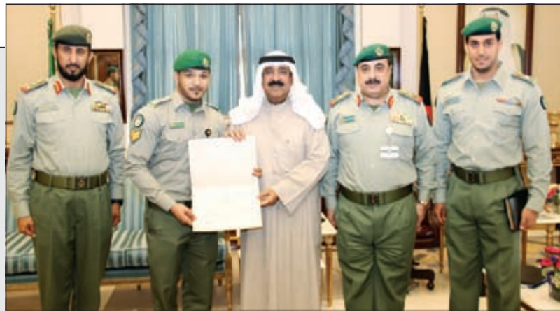
الشيخ مشعل الأحمد مستقبلاً الفريق ركن م. هاشم الرفاعي والعميد ركن بدر عبدالله حمد والرفيق علي صالح خليل

مشعل الأحمد منح رقبياً بالحرس الوطني وسام الواجب العسكري وترقية استثنائية 04