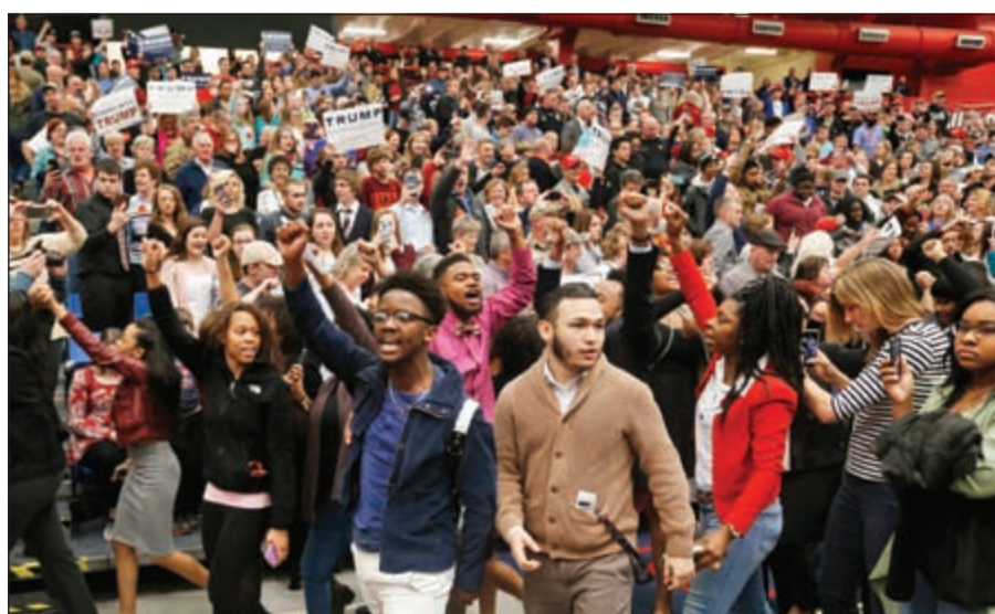
أميركيون من أصول أفريقية يهتفون ضد ترامب في مهرجان خطابي في فيرجينيا

شبان من جماعة «كل حياة مهمة» التي تشكلت للدفاع عن الأميركيين السود بوجه جماعة «كو كلوكس كلان» أو «KKK»، التي تدعو إلى حرق السود أحياء، وزعيمها السابق