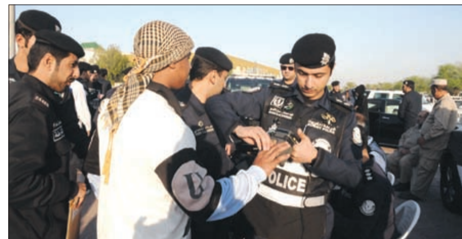
تصميم أحد الموقوفين في الحملة قبل اتخاذ الإجراءات القانونية بحق

تابعت أجهزة وزارة الداخلية تنظيم الحملات على المناطق العشوائية حيث استهدفت حملة ضخمة مخالفي الإقامة والعمالة الساتية في منطقة الجليب إلى جانب الأوكاز المشبوهة. وأسفرت الحملة - التي قادها وكيل الداخلية الفريق سليمان الفهد ورافقه خلالها وكيل وزارة الداخلية المساعد لشؤون الأمن العام اللواء عبدالفتاح العلي - أسفرت عن ضبط 4015 مخالفاً، وتم تحويل 1053 منهم ل-