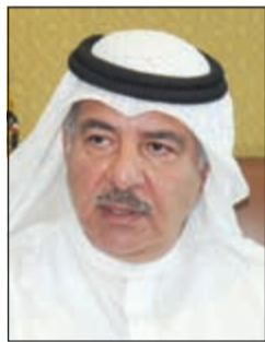
المستشار صلاح المسعد

أعلن رئيس هيئة الفتوى والتشريع المستشار صلاح المسعد عن فتح باب القبول لعدد من خريجي «الحقوق» قريباً وفق شروط ومعايير، مضيفاً أن الإيقاف خلال الفترة الماضية كان لظروف معينة وقضايا محددة، مؤكداً أنه سيتم إعطاء كل ذي حق حقه للعمل في الهيئة من المتميزين. وتعهد المستشار المسعد بأن تتجاوز الهيئة كل الأخطاء التي كانت تقع فيها في السابق، مبيناً أن الهيئة تدعم الحكومة في قراراتها إذا كانت تلامس صحيح القانون، وكشف عن أن القضايا التي تخسرها الهيئة قليلة جداً مما كان عليه الأمر في السابق، موضحاً أن 90٪ مما يطرح من اتهامات بالتقصير للهيئة غير صحيح، وقال: سأقبل رأس كل شخص ينتقده ويصحح أي أخطاء من الممكن أن نفع فيها بالهيئة وليس لنا علم بها.