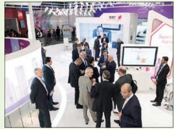
جناح VIVA في الملتقى

جناح شركة الاتصالات السعودية STC، بوفد من الإدارة التنفيذية في VIVA ممثلاً بكافة القطاعات المعنية في مجال التكنولوجيا والتسويق والخدمات والمبيعات، حيث تم عرض الإنجازات والتحديات التي حققتها VIVA منذ تأسيسها، فضلاً عن آخر العروض والخدمات والمنتجات التي تقدمها لعملائها ولزوار الملتقى. وقد حصدت VIVA خلال عام 2015 جائزة «أفضل مركز اتصال» وجائزة «أفضل مكتب دعم من فئة المكاتب المتوسطة»، وذلك اعترافاً بتميزها في قطاع