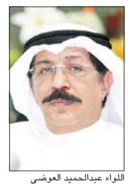
اللواء عبدالحميد العوضي

شقيقته المتزوجة من خليجي على اسمه ليصبح الخال هو الأب على الأوراق بحيث يستفيد ابن شقيقته من جميع الامتيازات التي يحصل عليها المواطن. وبحسب مصدر اممي فإن معلومات وردت الى اللواء العوضي من ان ضابطا في الداخلية برتبة ملازم أول سجل ابن شقيقته على اسمه،