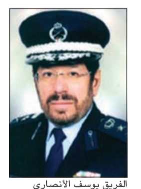
الفريق يوسف الأنصاري

والإنقاذ البحري بحضور الأمين العام للمنظمة الدولية للحماية المدنية. د.فلاديمير كوفشنيوف، حيث أن هذه الدورة أتت ضمن أهداف الإدارة العامة للإطفاء الإستراتيجية الدولية ومشاريعها المتعددة لإقامة السدورات المتخصصة بعد انضمام الإدارة العامة للإطفاء إلى المنظمة الدولية ممثلة عن الكويت وفقا للمرسوم السامي رقم 129/2015، وأضاف الفريق الأنصاري أن هذه الدورة يشترك فيها 26 مشاركا من 14 دولة من الدول الشقيقة في الخليج والوطن العربي