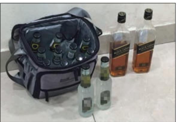
المضبوطات لحيات إلى «الكافحة»