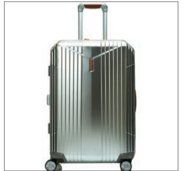
جمع فريد بين الفخامة والمتانة

العمال الحرفيين، يجري وضع الإطار على التصميم الخاص بالحقيبة. ويجري فصل وتلميع كل حقيبة لوحدها بطريقة يدوية وبشكل حازم، لضمان الحصول على سطح لامع مدش، لضمان استدارة دقيقة، يخضع كل دوّاب لفحص دقيق، ويركب على الحقيبة بدويا، لمنع كل حقيبة شكها الفريد والاستثنائي، تستخدم مسامير خاصة بـ «هارتمان» لجمع كل العناصر بعضها ببعض، وداخل الحقيبة، تلف أجزاء كثيرة ببساطة فاحرة، لإضفاء مظهر منسق ومتناسق.