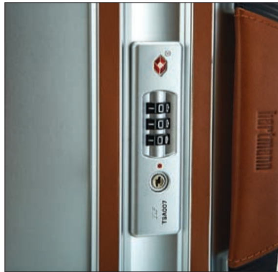
انظمة حماية متطورة