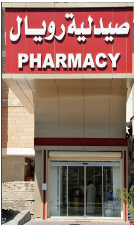
الفرع الجديد لصيدليات رويال في الجابرية