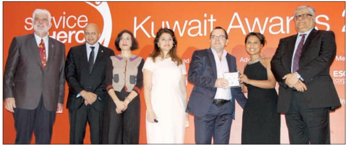
ممثل شركة الشايح يتسلم جائزة المركز الأول عن فئة الملابس الجاهزة والإكسسوارات

تقدمها أكثر من 300 شركة. تعمل في مختلف القطاعات. وقام المستهلكون في الكويت بتقييم مختلف الشركات عبر موقع «سيرفس هيرو» على أساس ثمانية معايير وهي: سلوك الموظفين، والموقع، وسرعة الخدمة، والثقة في المنتج، وجودة الخدمة أو الإنتاج، والسعر مقابل القيمة بالإضافة إلى معيارين لتقييم مركز الاتصال والموقع الإلكتروني.