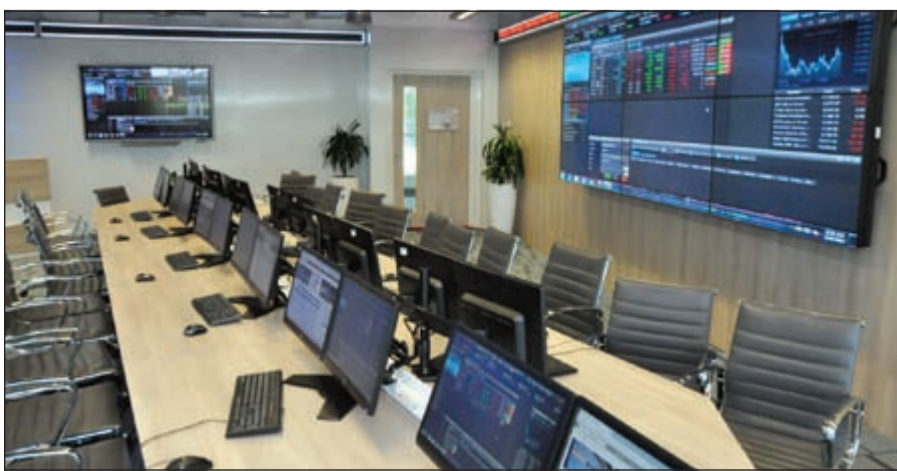
مركز الخليج المالي بجامعة الخليج للعلوم والتكنولوجيا يساهم في تحويل الكويت لمركز تجاري عالمي

لقد ركزنا على المشاريع الصغيرة بالفعل لما رأيناه من قابلية بأن يحظى هذا الشق من أهمية في الاقتصاد بشكل عام وكذلك رأينا من المواهب