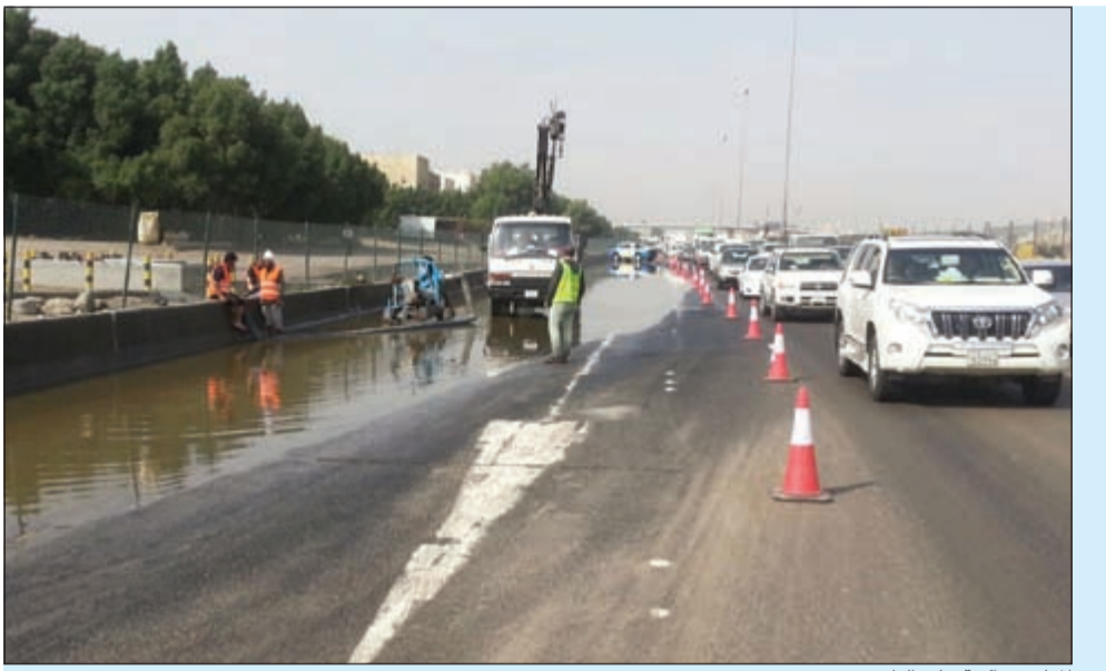
امياه متراكمة على الطريق

تبدأ الحكومة خلال فترة وجيزة تفعيل العديد من الرؤى والأفكار التي طرحت مسبقا حول قضية الإصلاح الاقتصادي ومنها برامج التخصيص خصوصا في بعض قطاعات الخدمات. وفي هذا الإطار، قال مصدر حكومي مطلع لـ «الأنباء» ان فكرة خصخصة الجمعيات التعاونية عادت للظهور من جديد كأحد الأمور التي يمكن من خلالها تحسين مستوى الخدمات العامة والذي يأتي من فتح باب التنافس ثم تحقيق عوائد مالية واقتصادية للدولة. وأشار المصدر الى ان الفكرة آتية لا محالة كونها تعود بالنفع العام على الوطن والمواطنين، موضحا ان الحكومة جادة في الخصخصة وليس فقط التعاونيات، انما هناك عدة قطاعات سيطولها ملف التخصيص لتحريك عجلة الاقتصاد في البلاد. وقال المصدر ان دراسة الحكومة التي يناقشها مجلس الأمة في اللجنة المالية تشير الى ضرورة تخصيص بعض قطاعات الدولة، وهذا ما سيتم التوافق عليه بين أعضاء الحكومة والنواب في المجلس. وفي هذا الإطار، حذر النائبان محمد طنا وسعود الحريجي من خطوة خصخصة الجمعيات الحكومية، معتبرين ان مثل هذا الإجراء مشروع أزمة بين الحكومة والمجلس.