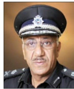
اللواء فيصل السنين

محرر رسمي، كما أن دخول البلاد بجواز سفر مزور سابقا ليس مبررا لأن يستمر التجاور، بمعنى انه قد يكون هناك خلل ما حدث، وتمكن شخص من دخول البلاد بجواز سفر مزور وعاد وسافر، وحينما عاد تم اكتشاف التزوير فيتم إبعاده أيضا، وبالتالي لا يمكن التعويل على أنه سبق أن استخدمه في الحضور إلى البلاد، مؤكدا ان المطار مزود بأجهزة متقدمة لكشف الجوازات المزورة. وشدد اللواء فيصل السنين على