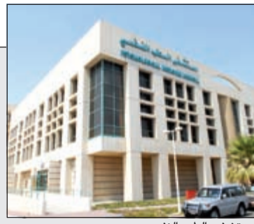
مستشفى الطب النفسي